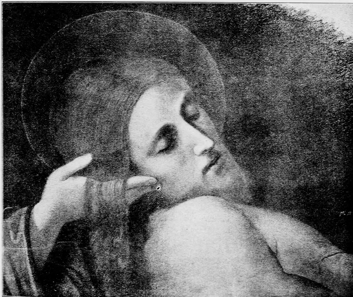
Z križa zosňatý Pan Ježiš v náručí sedmiboľstnej Panny Marie.