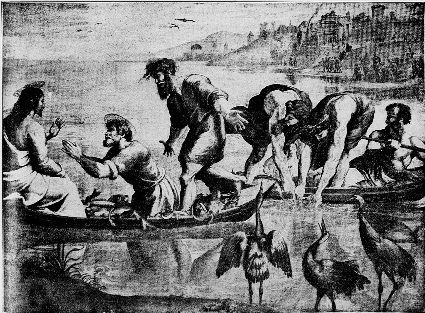
Zázračné lovenie rýb svätého Petra.

obecenstvo stoličné rozposlali vyzvanie, aké tým najširším kruhom spoločenstva slúžiť má za príklad v každom ohľade nasledovania hodný. S radosťou vítame zmužilých vodcov kresťanskej ľudovej strany v stolici hontianskej a ku všestrannému povzbudeniu spomenuté vyzvanie podávame v zkrátenom výfahu. Vodcovia kresťanskej ľudovej strany v jejich vyzvaní po krátkom vy-