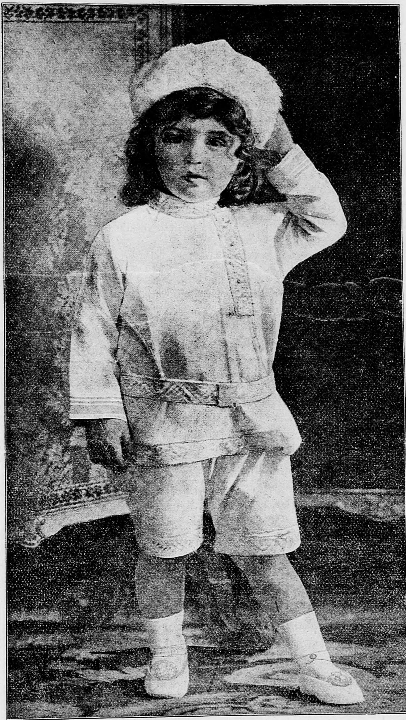
Následník ruského trónu.

Ukradli zlato. Z Máramarosszigetu oznamujú že z baní na zlato v Horgospataku a Oláhlaposbáni ukradli zlata v hodnote asi stotisíc korun.