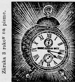
Zárúka 3 rokov na pisme.

S 1. zvonkom, ocelová kotva a zástavidlo K 3.80. — S osvetleným v noci číselníkom K 4.20. S 2. zvonkami, ocelová kotva a zástavidlo 4.40. — S osvetleným v noci číselníkom 4.80. Súbežné budič hodín: 2.90. S osvetleným v noci číselníkom 3.30. Záruka 3 rokov na pisme. — S tovarom nespokojným vrátiť sa peňaze. Rozposielanie s poštovou dobierkou.