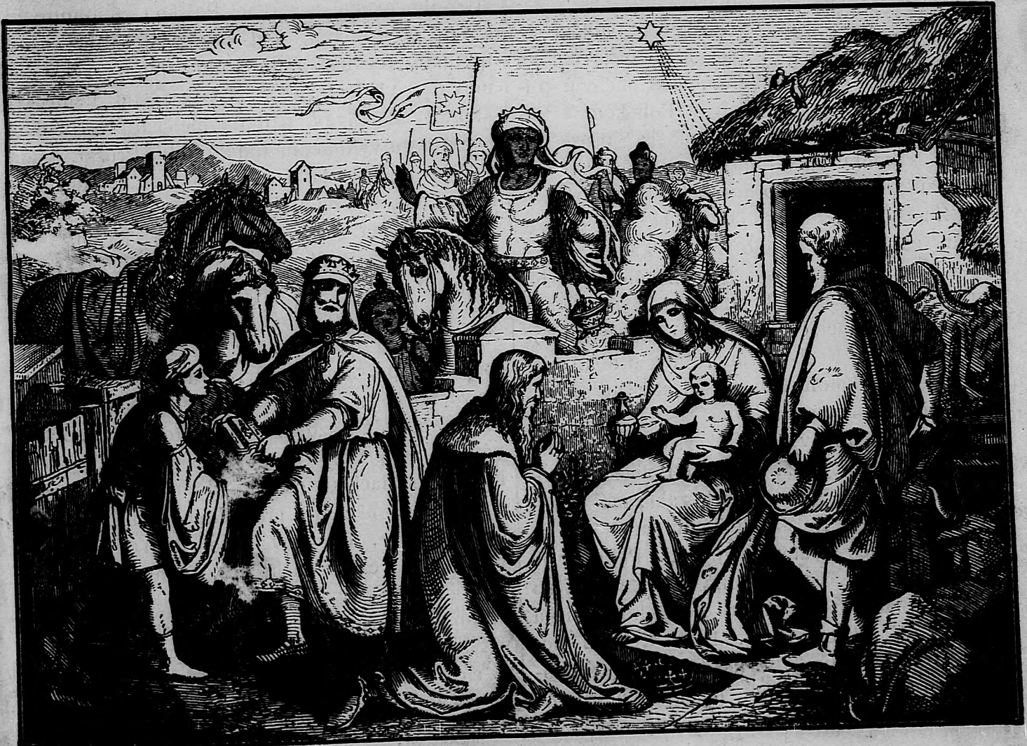
Svätí Kráľovia od Východu.

ako tiež požiadavka kresťanskej spravodlivosti je, aby dielky v ľudových školách vyučované boli v reči pospolitého ľudu. Pohnutá citami spravodlivosti, na dejišti verejnopolitickom žiadala kresťanská ľudová strana, aby úradníci verejnej správy obcovali s ľudom v jeho materinskej reči a úradné predvolania a uzavretia aby sdelili ľudu v reči srozumiteľnej. Spravodlivosť