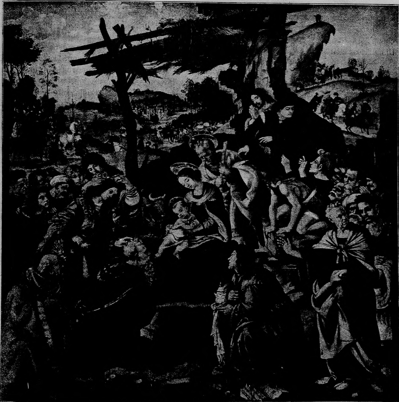
Sväti traja Kráľovia.

Redakcia a vydavatel'stvo : Budapest, IV. ker., Ferencz-József-rakpart 27. szám. sem sa majú posielat' predplatky, jako dopisy do novin ohlásky a náhodné reklamácie. Cena jedného 5 stĺpcového nonpareill riadku 80 hl. Rukopisy sa naspak neďavajú.