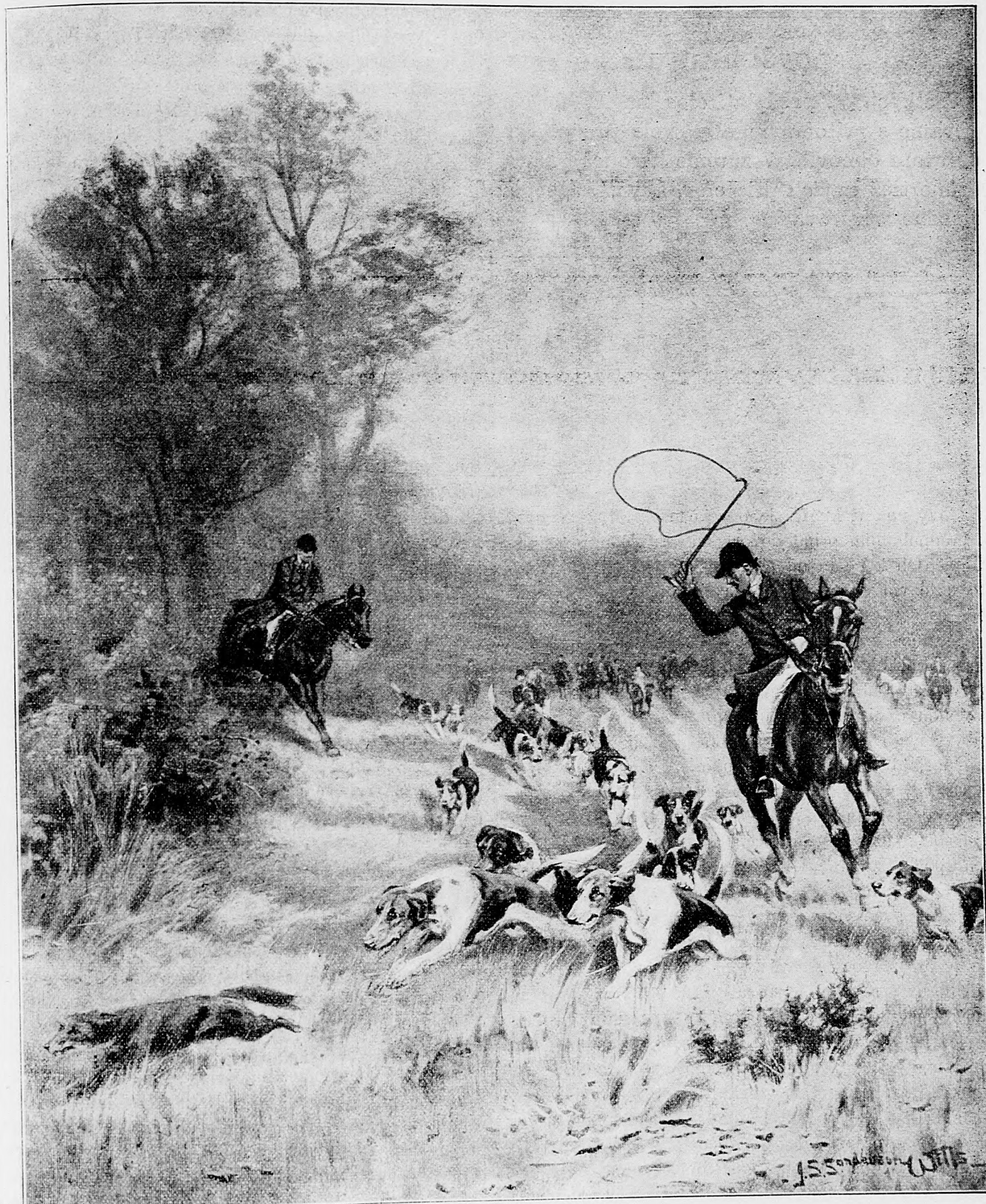
Polovačka na lišku.

Kat prosil mučenníka za odpustenie. Páter Ogilby ho obejmul, potom hodil svoj ruženec medzi ľud; ruženec