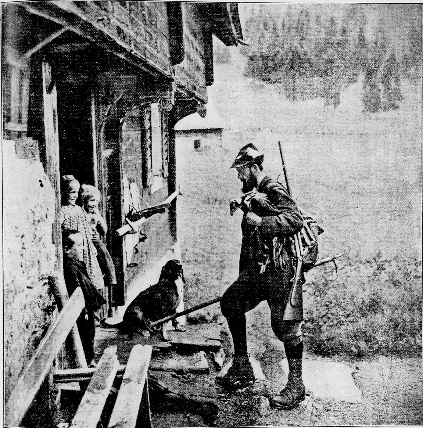
Olúpil orlové hniezdo.