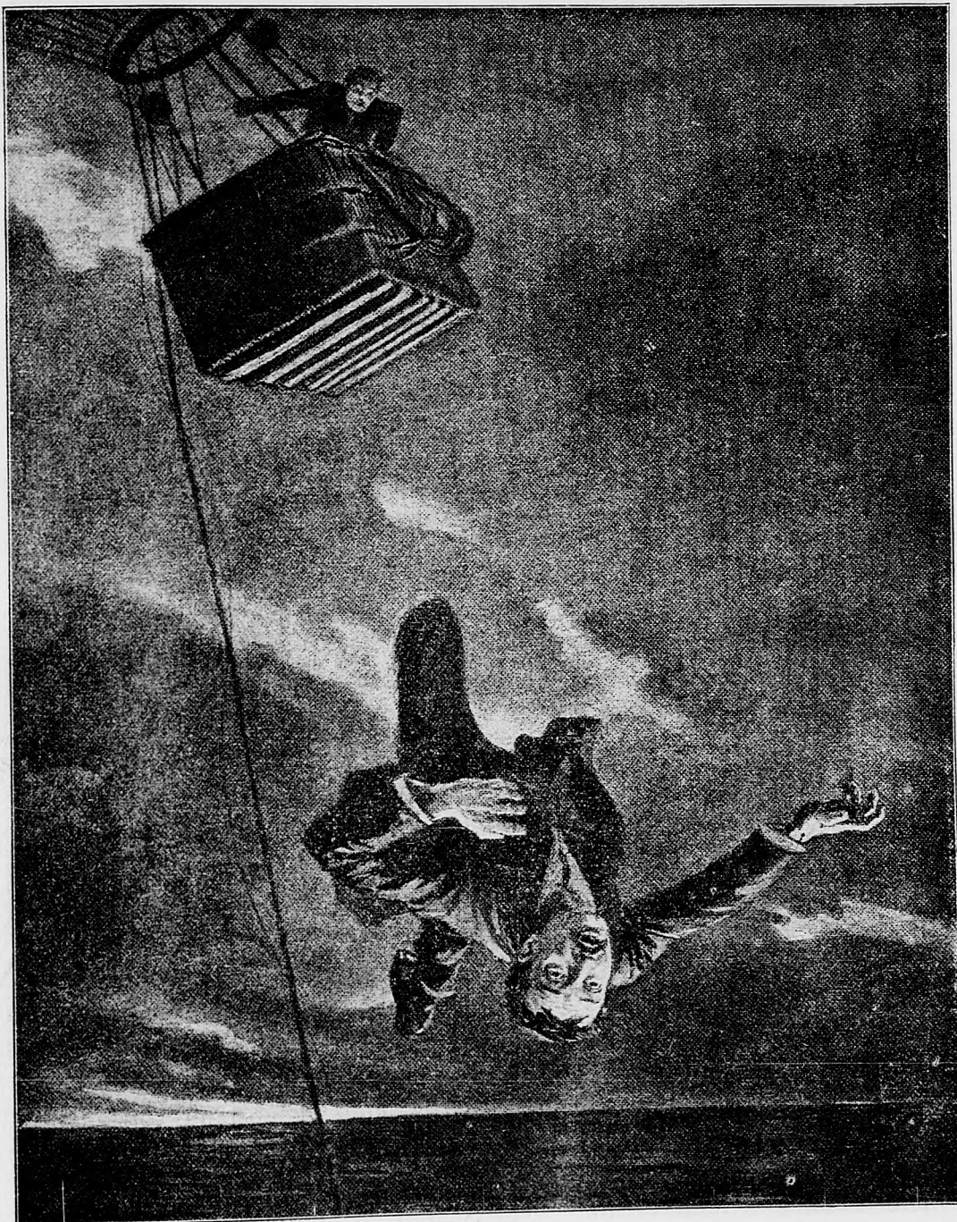
Obet vzdušnej lode.

sem sa majú posielat' predplatky, taktiež dopisy do novin ohlasy a náhodné reklamácie. Cena jedného 5 stĺpcového nonpareill riadku 30 hl. Rukopisy sa nazpak nedávajú.