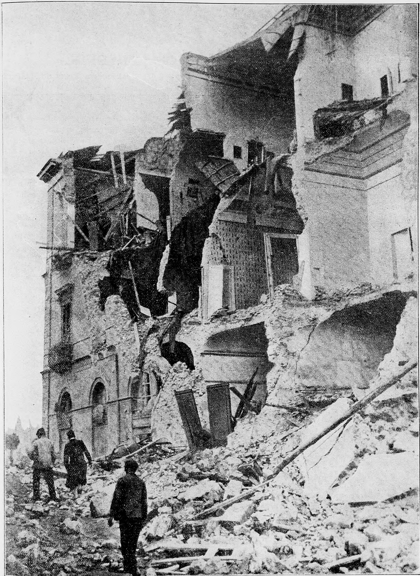
Čo znamená zemetrasenie.