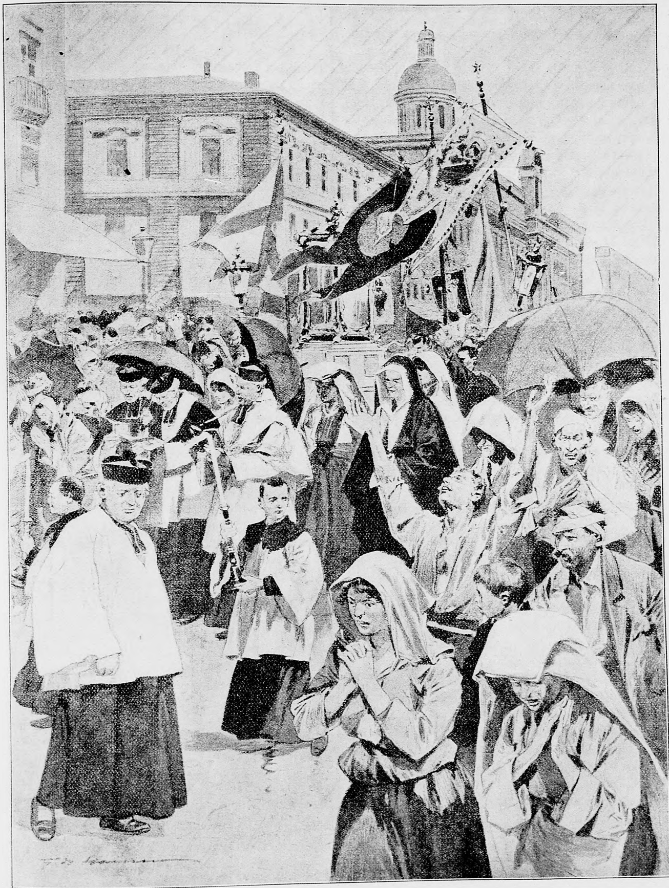
Fochod v Catanii o odvrátenie zemetrasenia.

toľto žiadal, aby nový kostol posvätil suspendovaný ružomerský farár Ondrej Hlinka a ponevác toto ne-