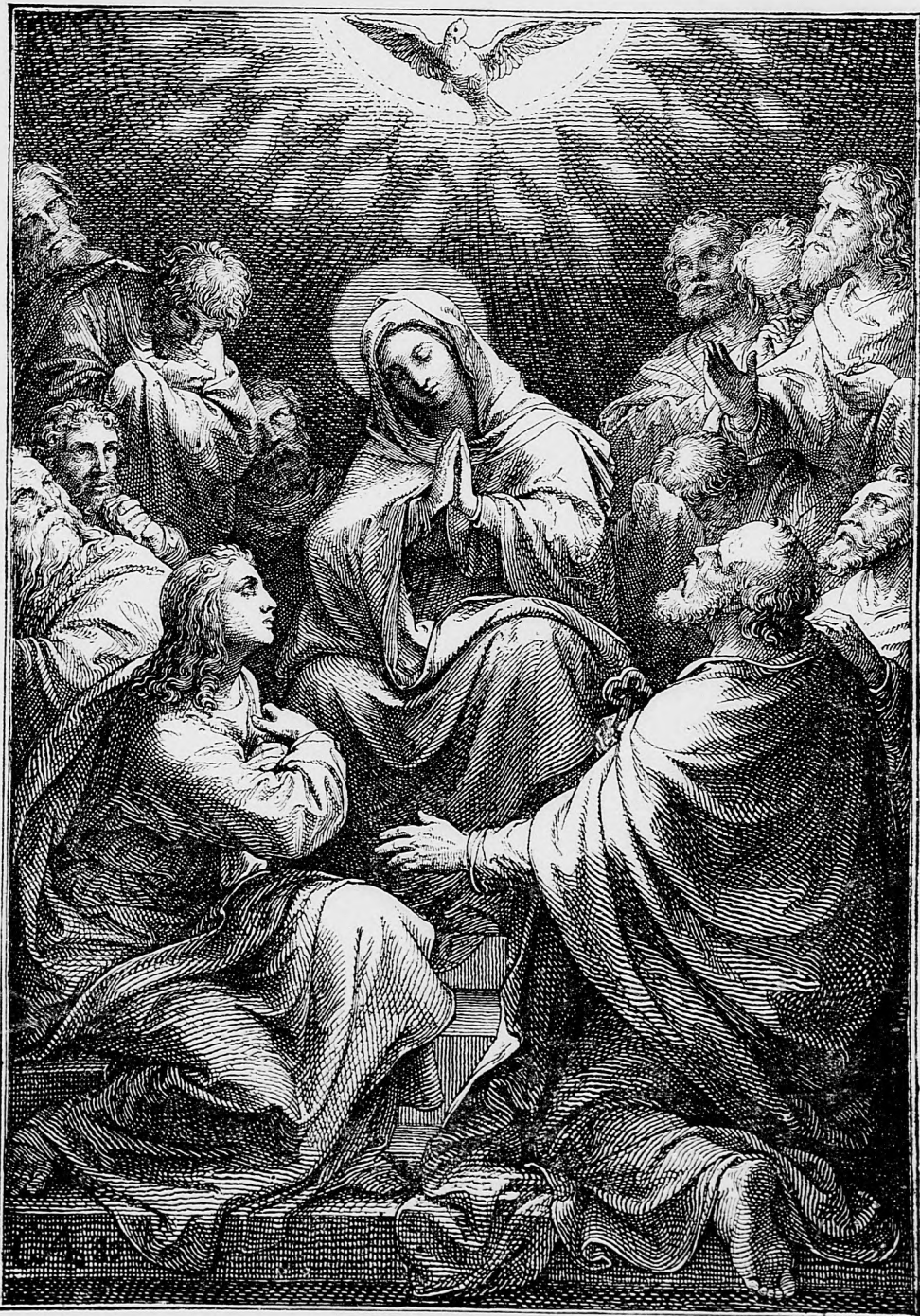
Zoslanie Ducha svätého.

Ti ľudia skutočne, ktorí prítomne na tom pracujú, aby cirkev Kristovú zničili, sluhov jej vyhnali z kostolov a zo škôl, neznajú ani Boha, ani Spasiteľa Ježiša Krista. Proti bezbožnému počínaniu podobných ľudí vydáva Duch svätý Utešiteľ