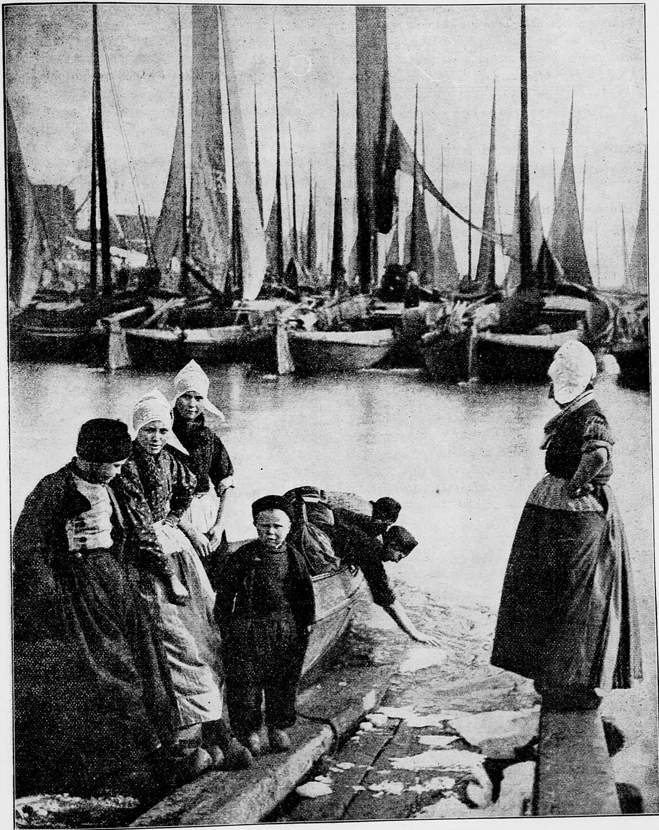
Hollandské dievky pri prádíe.