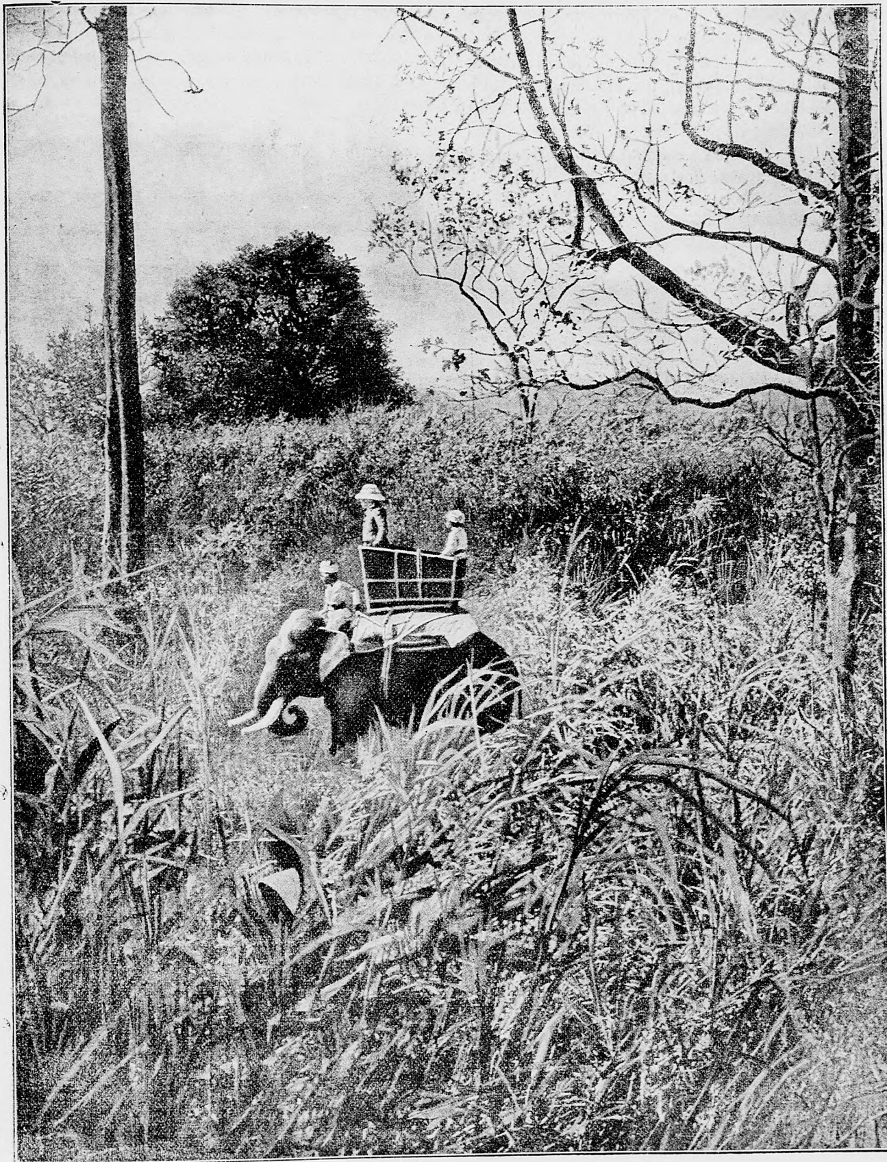
Polovačka na slone.

vystrkovského, vtedy už kanonika nitrianskeho. A skutočne priblížili sme sa k jeho domu, a ukázal som im