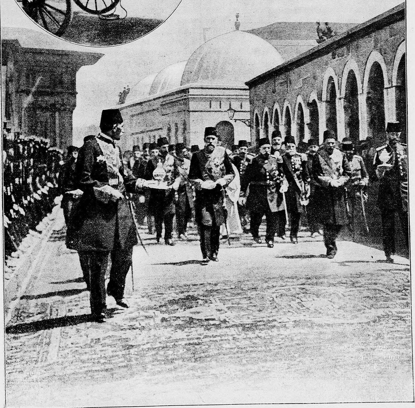
Mahomed V. nový cisar turecky.