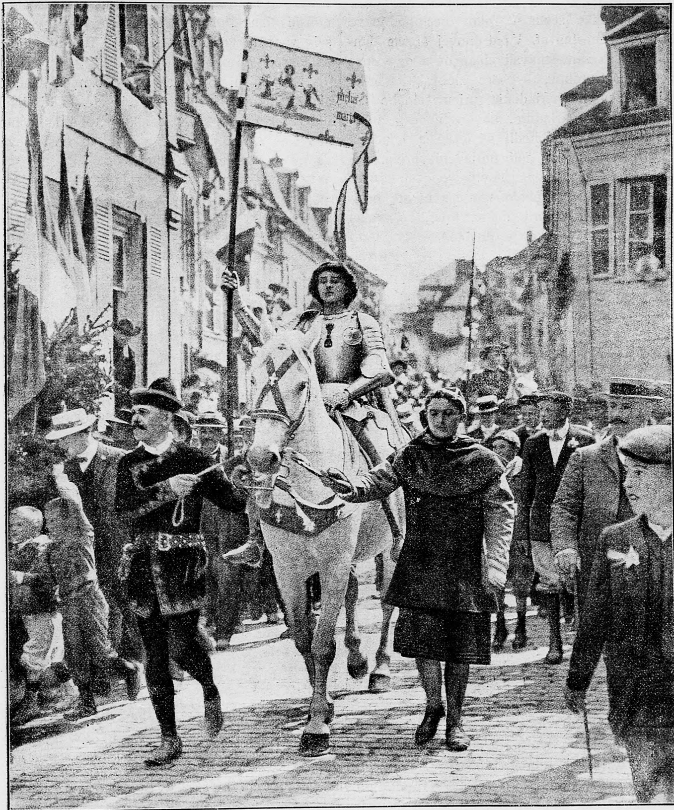
Johanna d'Arc, zmužilá dievka francúzska, po vydobitom víťazstve slávnostne vťahne do mesta Orleansu. Pápež Pius X. Johannu d'Arc toho roku vo veľkonočné sviatky za blahoslavenú vyhlásil za prítomnosti 30 tisíc Francúzov v bazilike sv. Petra v Ríme.

sledovný patrón takou silou padol, že kapsla vybuchla a od tejto zas pušný prach.