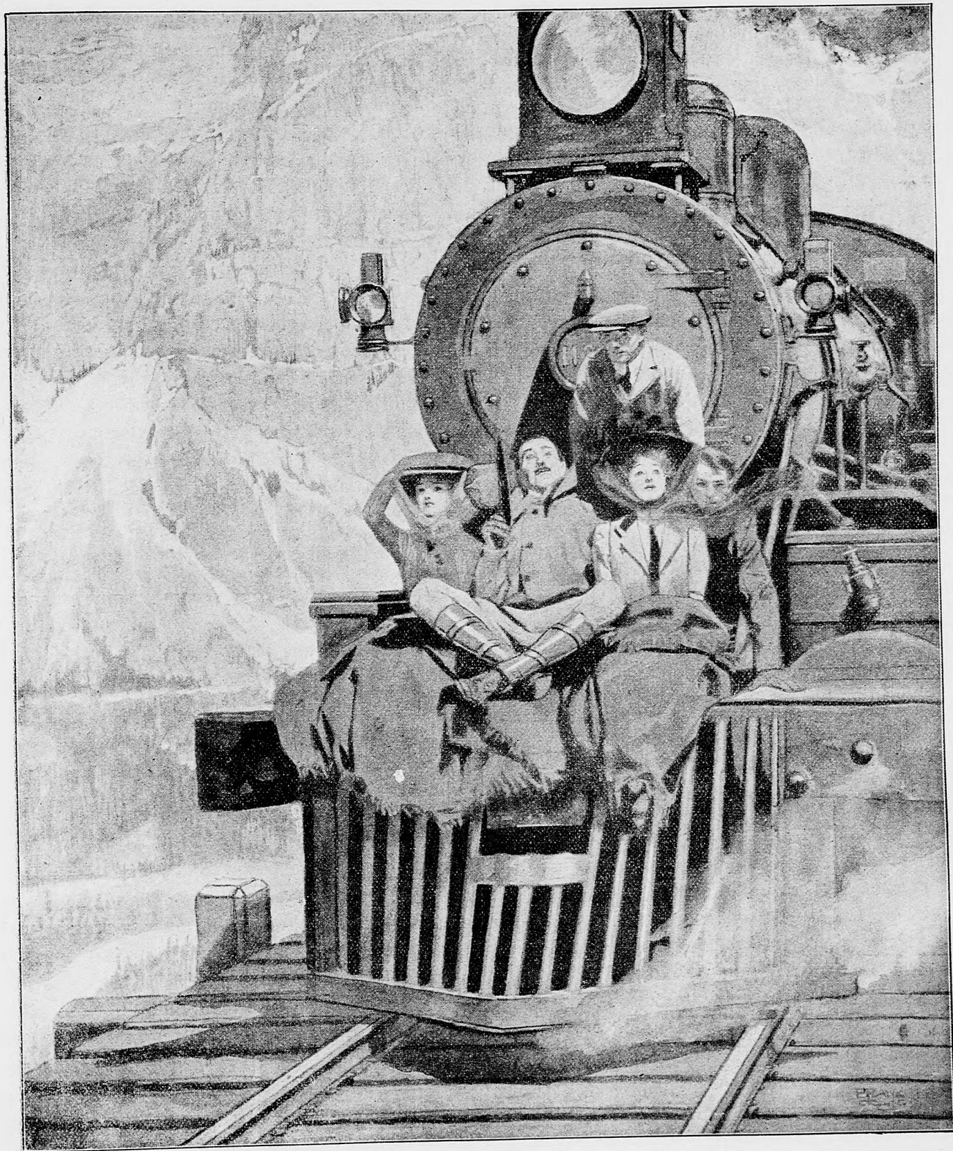
Zábava amerických millionárov.

ju ale zas nehoda a doletela do Friedrichshafenu, keď kráľ ztadiaľ už odcestoval.