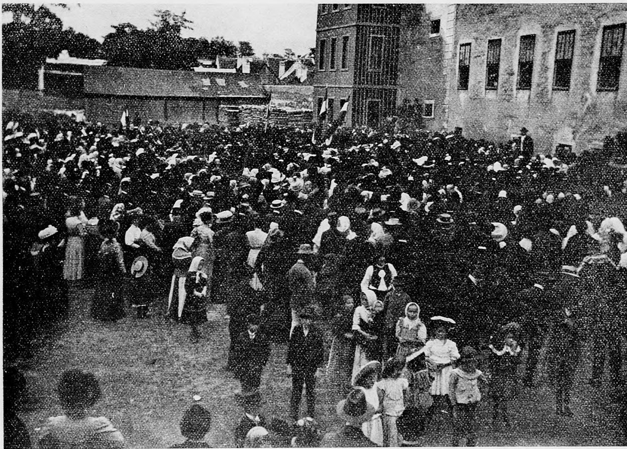
Veľké ľudové shromaždenie Katolickej ľudovej jednoty v Trnave, vydržiavané 19. septembra.