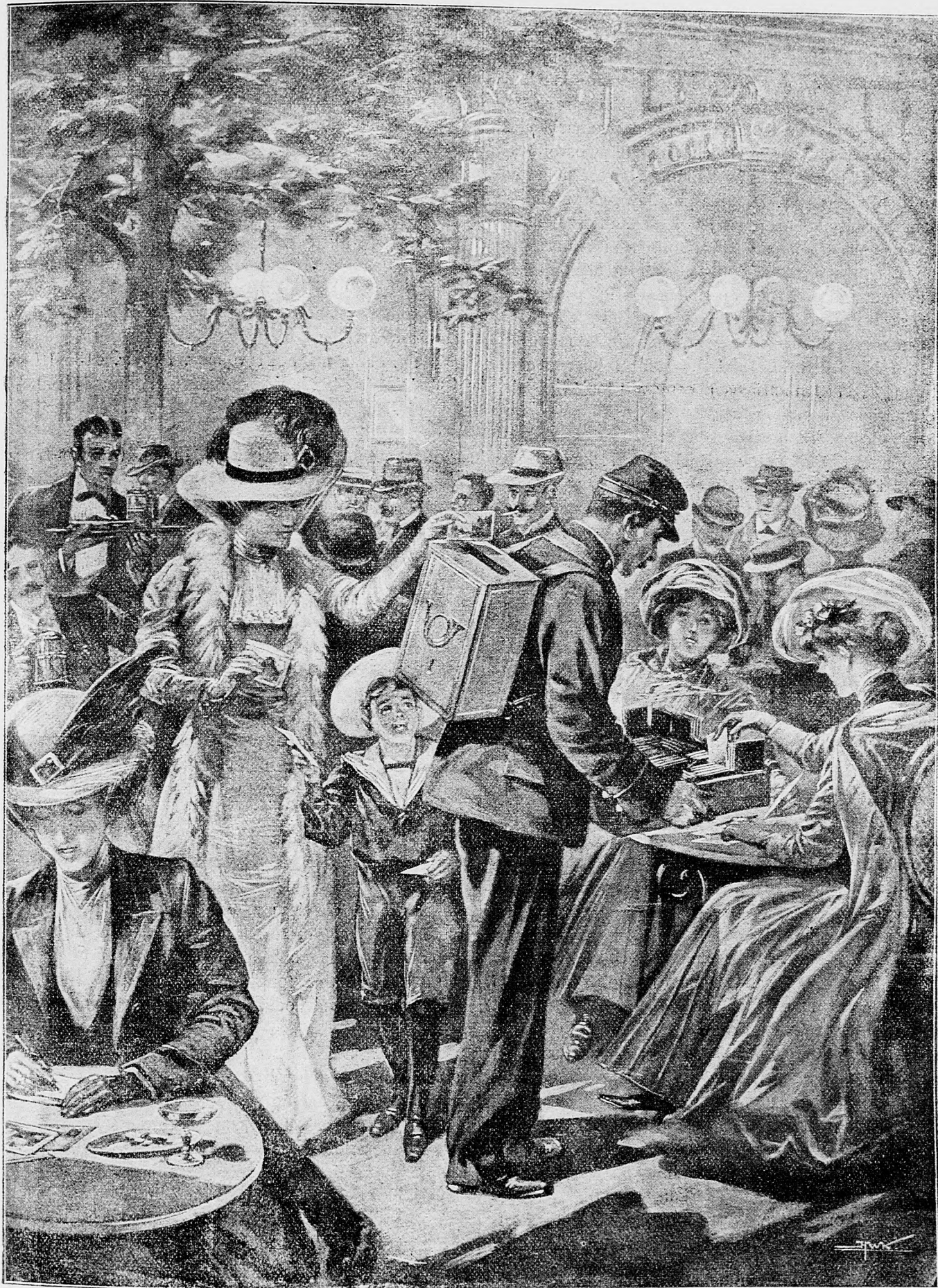
Pošta na nohách.