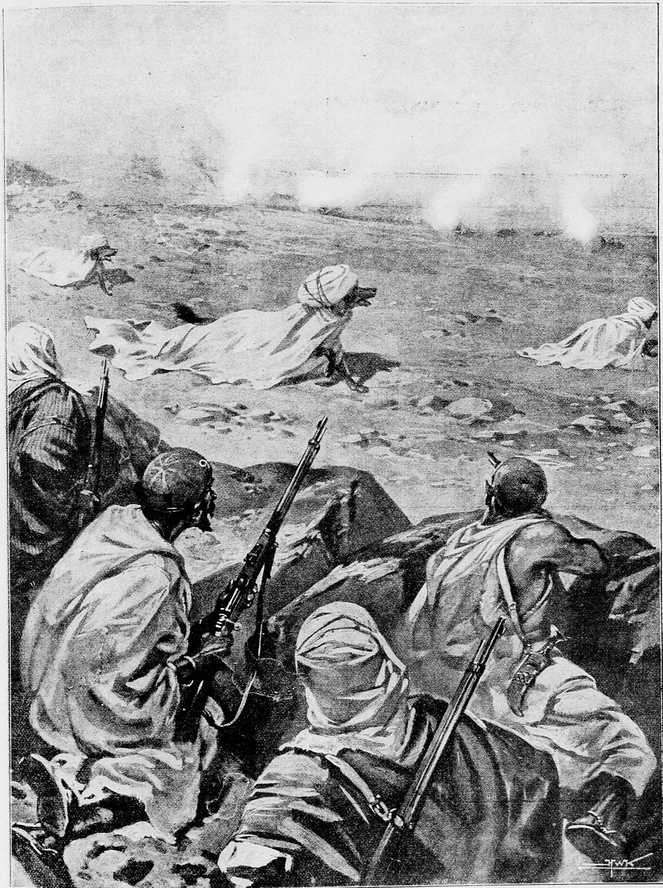
Mauri na postriežke.

Lebo štyridsaťpäťročná zvonárska služba zaslúži | takúto poslednú počesť.