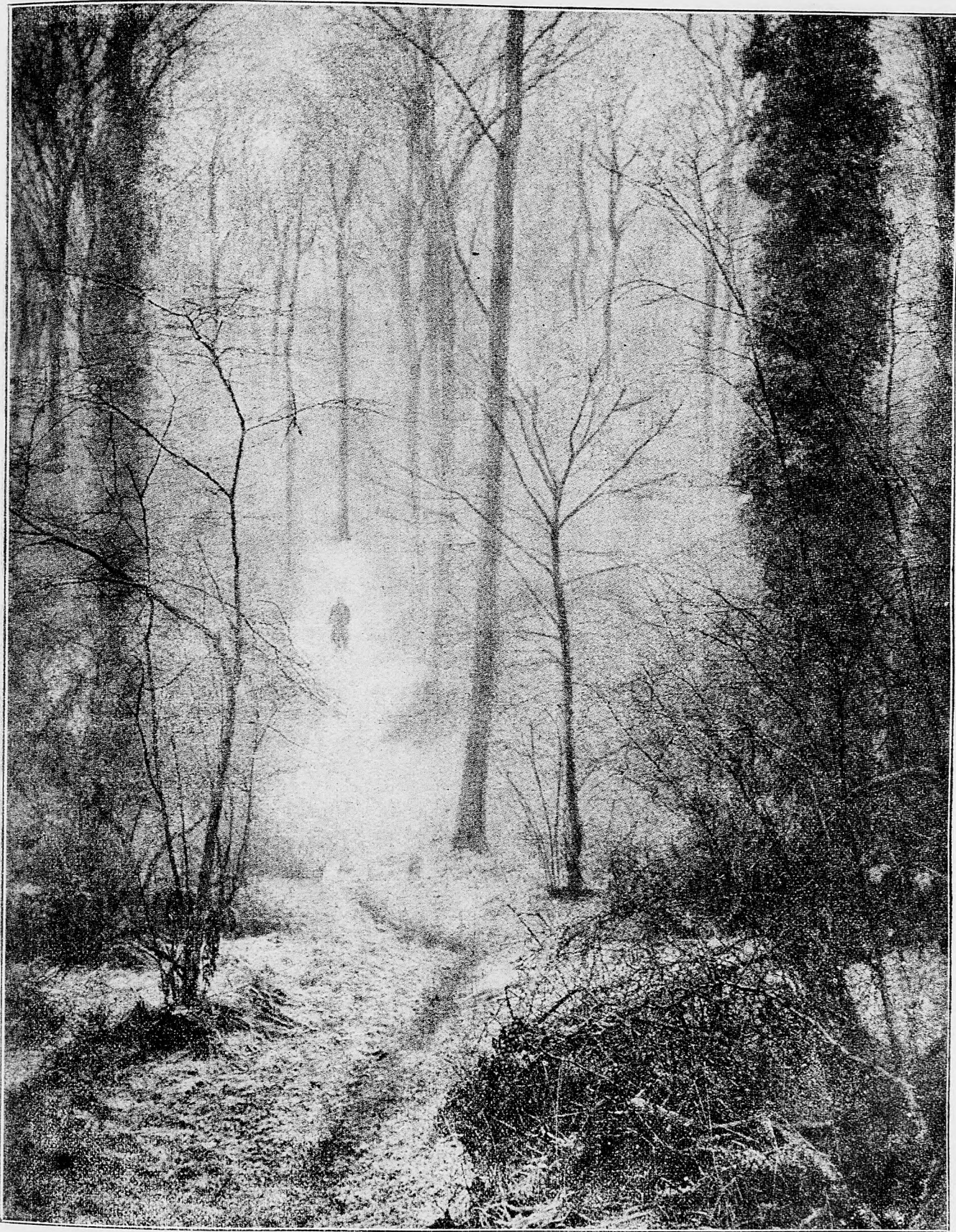
Zimný obraz hory.