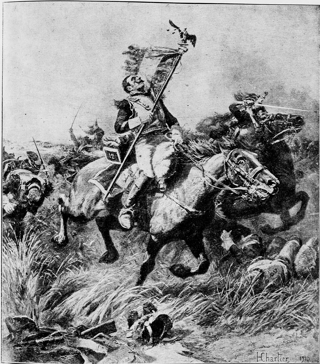
Do srdca streleny zástavník.

sledkom čoho chýrnu ríšsku radu znovu rozpustili. V Uhorsku schnali si v parlamente prevážnu liberálnu väčšinu a v Španielsku stroja sa olúpiť katolícku cirkev o jej majetky. V tomto pomáha slobodným murárom hlavný minister a zafatý slobodný murár menom