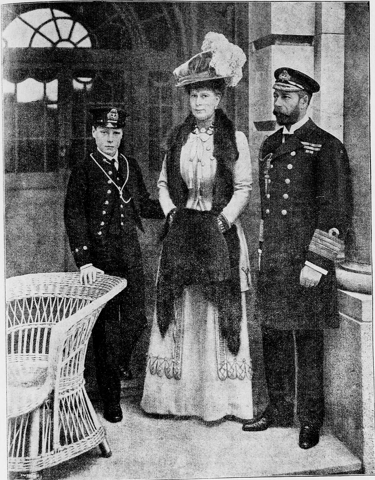
Nový anglický kráľ, kráľovna a dedič trónu.

mestove, kde sa tiež pretrhly oblaky, Biela a Čierna Orava vylialy sa z koryta a zaplavily všetko. Všeobecne sa vie, že jedným z najchudobnejších krajov našej vlasti je Orava a teraz