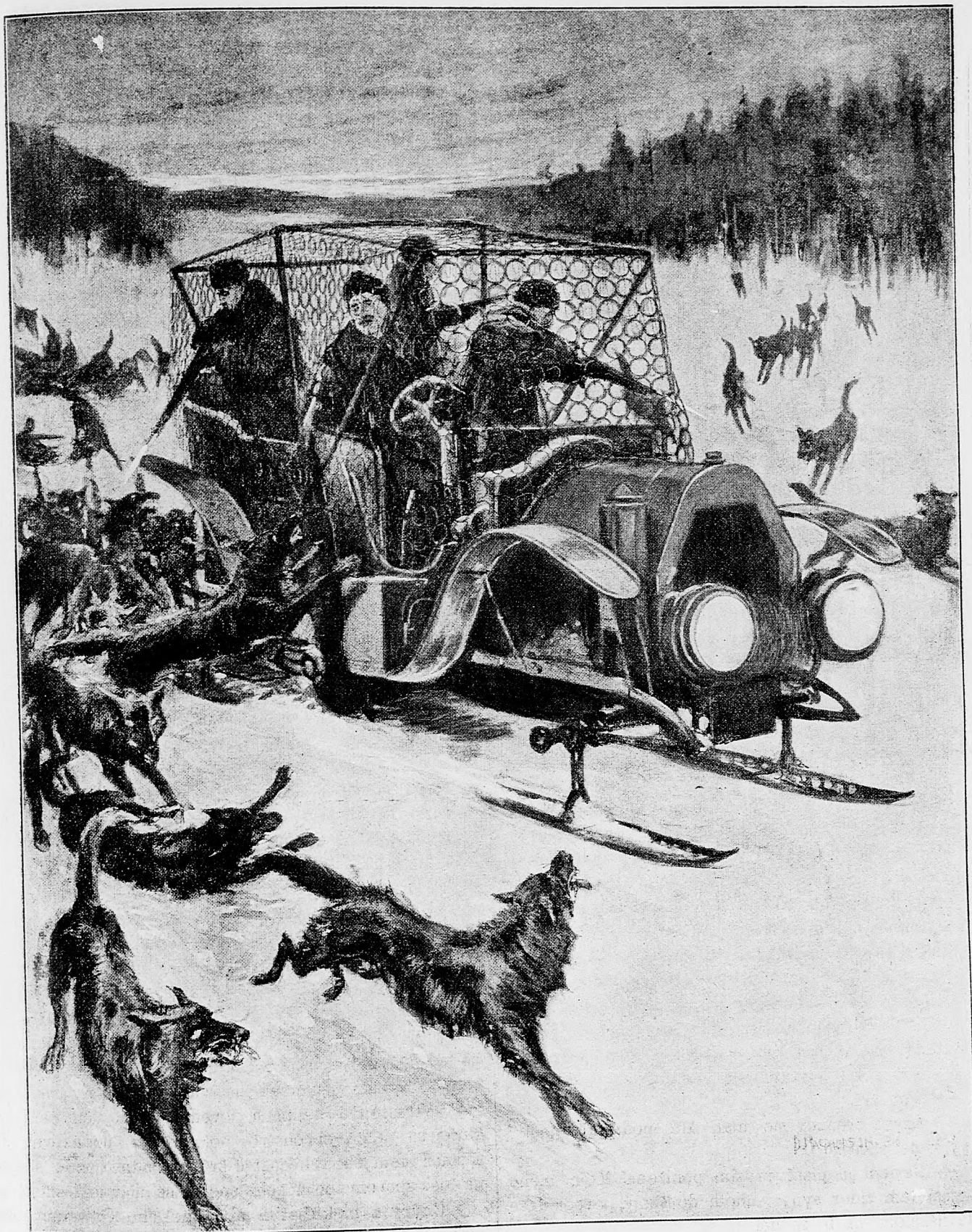
Polovka na vlkov dľa najnovšieho systému.

ských háboch, postál, zňal z hlavy klobúk a zohnul sa, aby mi ruku bozkal.