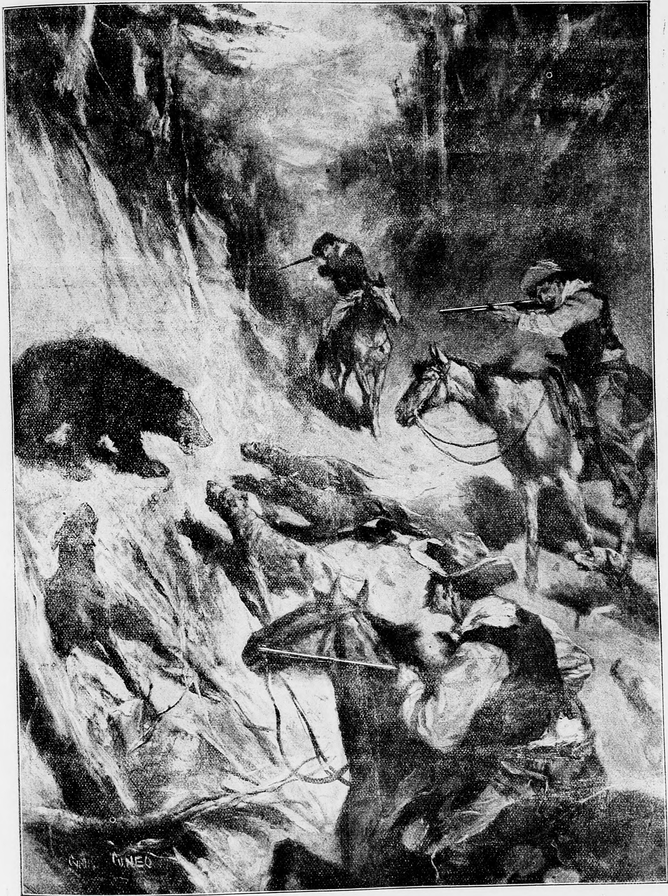
Poľovka na medveďov.