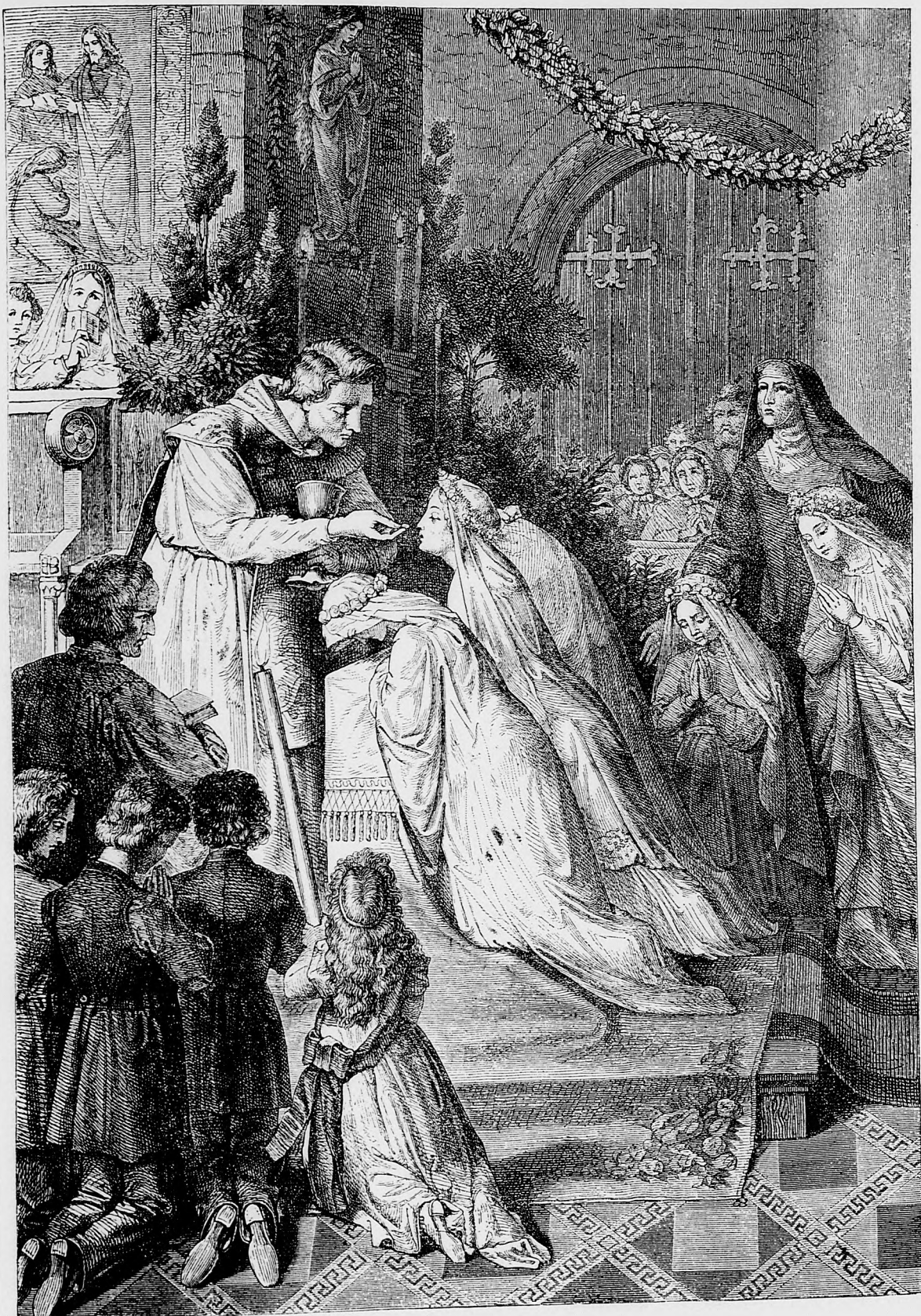
Prvé sv. Prijmanie.

uznania jeho horlivej účinnosti v záujme kruhu, z príležitosti jeho 80. narodenin vyvolil za čestného úda.