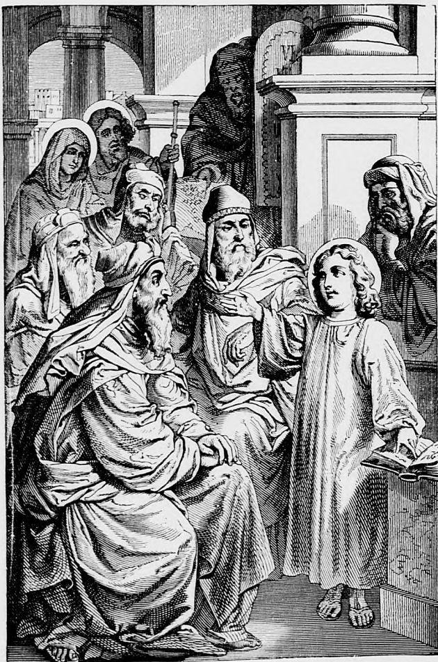
Dvanásťročný Ježiš v chráme.

volebným právom. Kto nečíta dobré noviny a nevie či táto alebo oná politická stránka pracovala za blaho ľudu alebo robila vždy len na tom, aby bohatli židia, ten potom pri voľbe ani nevie, na koho má hlasovať. Taký človek