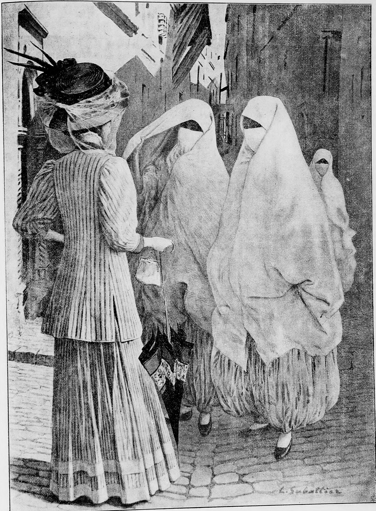
Ženský kroj na Východe.

Kráčal som ďalej a zastavil som sa pri jednom kostole. Dozvedel som sa, že je to kostol evanjelický. Na väzi bol síce kríž a nie kohút jako na iných kostoloch evanjelických. Má to svoj význam a upozor-