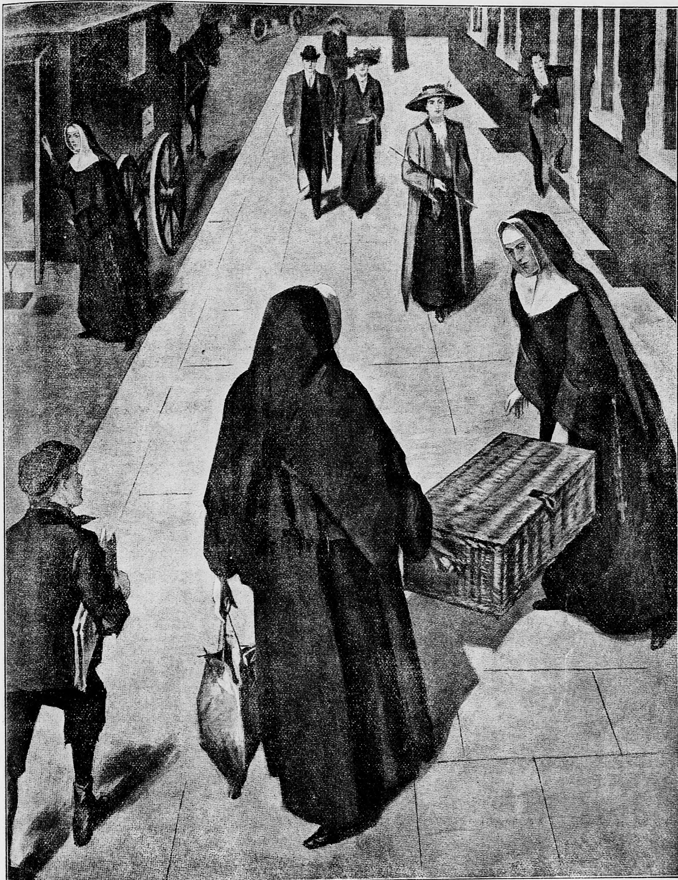
Almužnu sbierajúce mnišky v Londýne.

evanjelik». Veď týmto ľahko aj uraziť ste mohol pracovitost' syna a dcér.