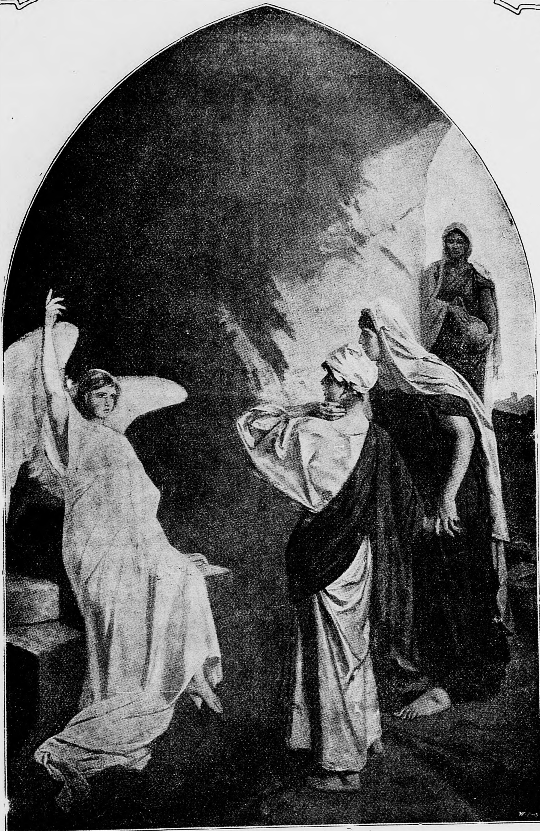
Vstal z mrtvých! Neni tu!

duje, že v jeho stolici isté je vífazstvo liberálnej strany. Föišpán ale pochválí slúžnovecov, že výtečne pracovali, po čom nasleduje odpočinok a mulatság.