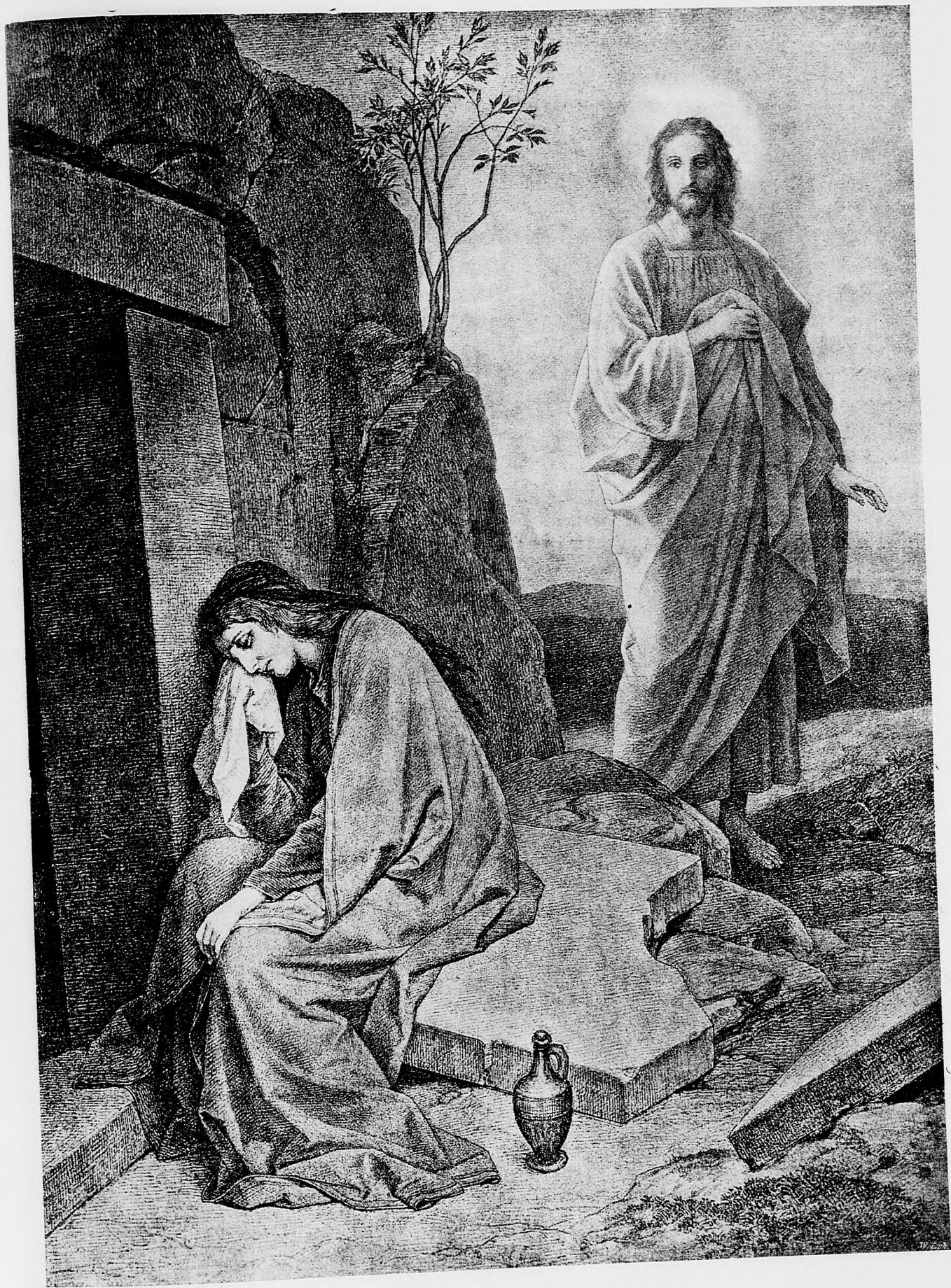
Vzkriesený Pán Ježiš zjavi sa Marii Magdalene.