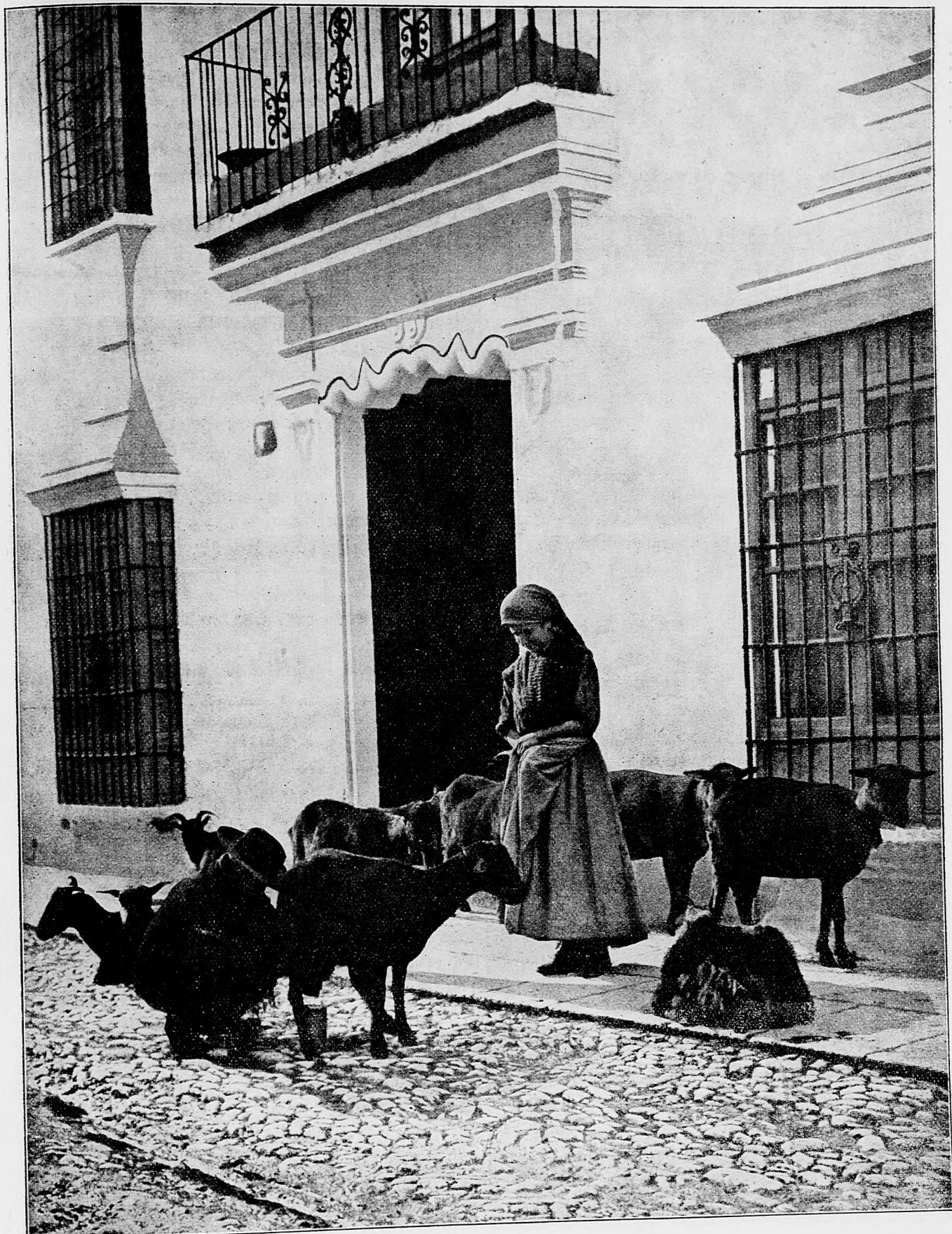
Predaj kozieho mlieka na Juhu.