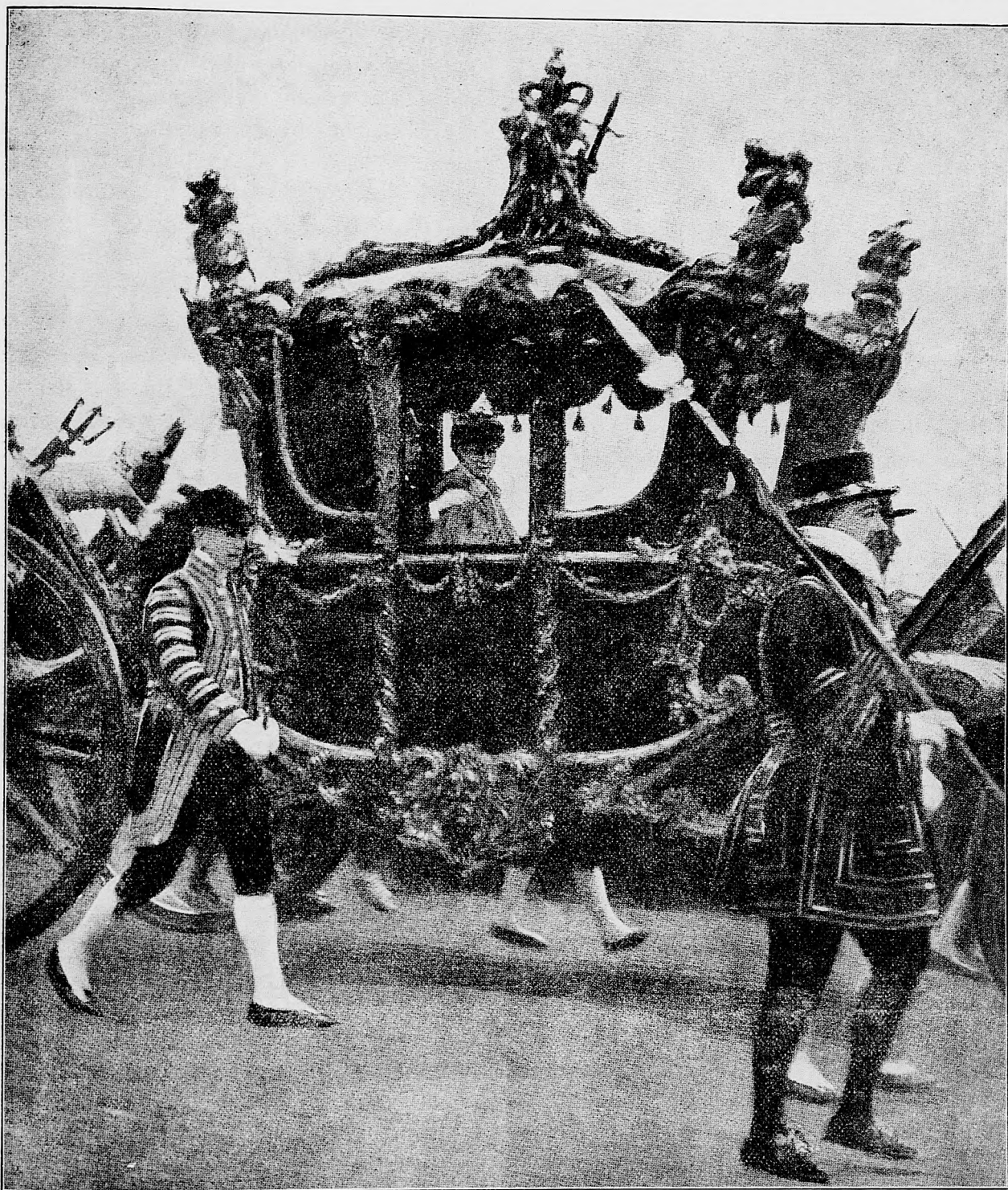
Parádny hintov, v ktorom anglicky kráľovský pár veze sa do parlamentu.

sebe bhojújú. Tvoj syn kheď bude ableghát, nech v dome ableghátov a na mestskej rade v Budapešti lhen vždy za svoj nhárod, za svoje židovské interessa, záujmy bhojuje, proti gho-