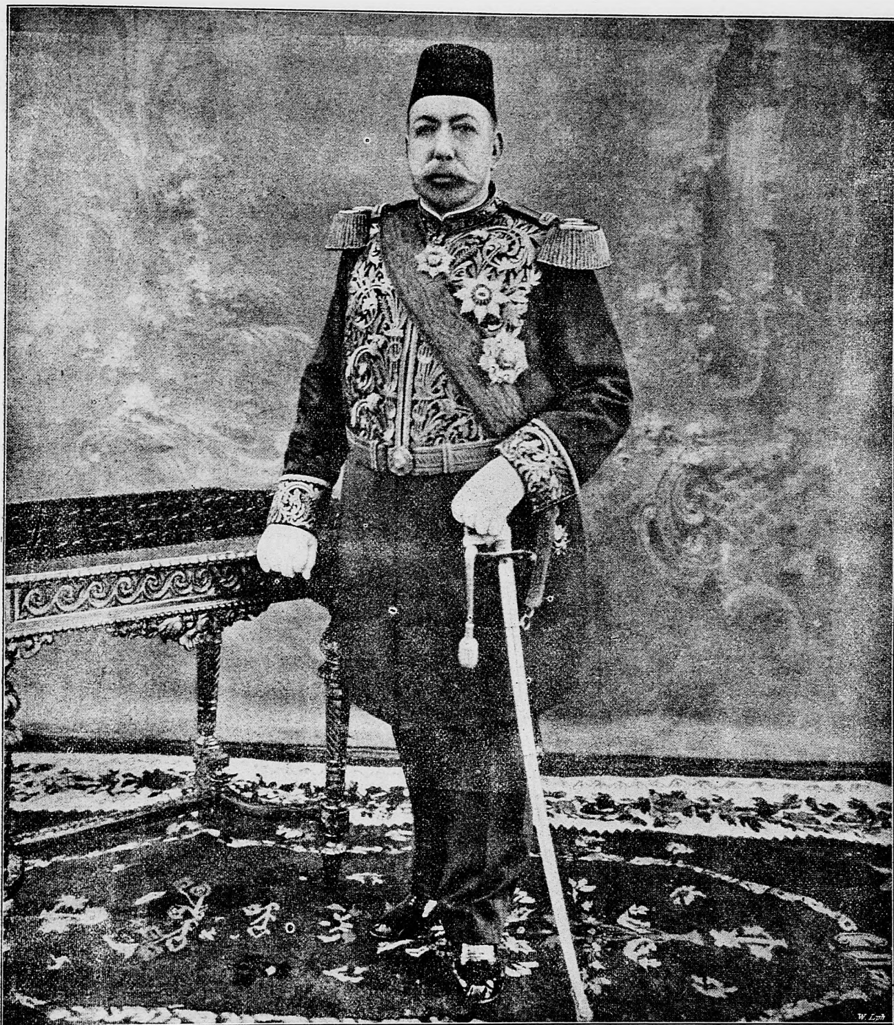
Turecký cisár (sultán) Mehmed Reshad V.

Keď prišli pred mestský dom, kráľ sa nemohol zdržať poznámky, taká pekná budova to bola s väzičkami.