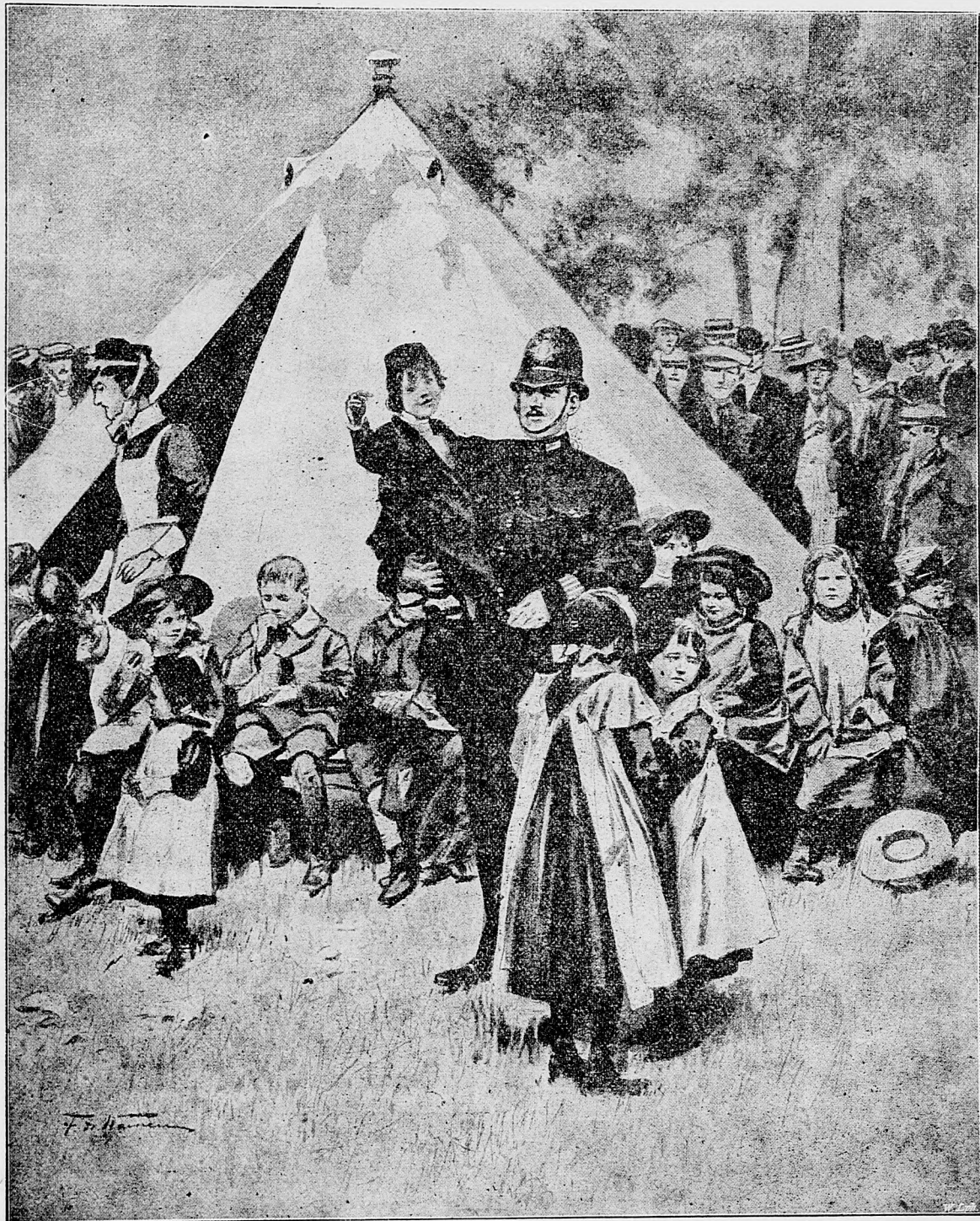
Zablúdené dietky v Londyne, ktoré dla zvyku policajti shromažďujú a ich hladajúcim odovzdajú.

Pozrimeže! Práve sa otvárajú malé uličné dvere. Dvaja mladíci vychádzajú z nich. Poznať, že obidvaja sú obuvníci pomocníci. Jeden už starší, dospelý muž;