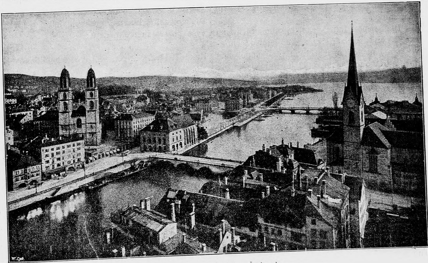
Pohľad na mesto Zürich vo Švajcarsku.

To neidem ani spomenúť, že za našu veľkú ochotnosť a za tie obete, ktoré sme na vojenské ciele donášali, ani nás, ani našich synov nevážili si veľmi, bo ako známo, ne jeden z našich mladíkov i samovraždy sa dopustil pre ne-