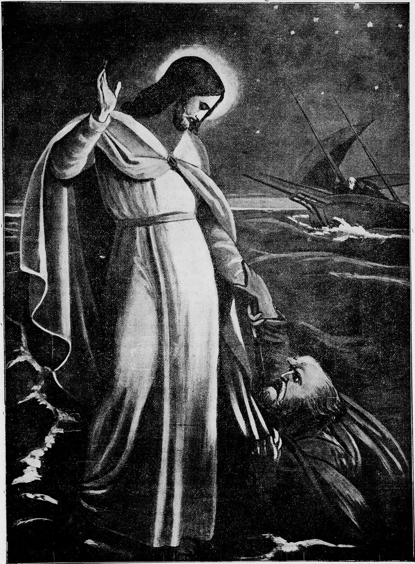
Pomoc Pána Ježíša.

esta na a v než via- y o vo- pří- Ta- ých v vy- ád- ce, ých sko jne ngu raz kej m, val er- ne- do- ky jú, me an- ár- om gu- aj ín- hili re-