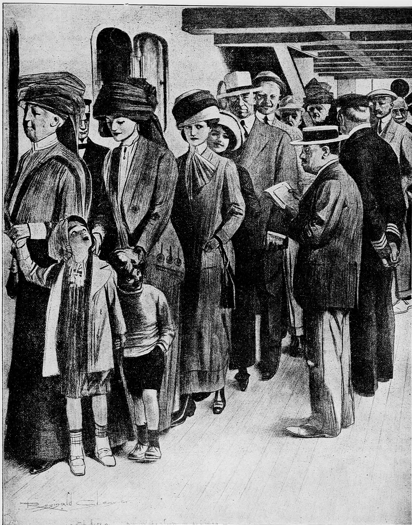
Odchod na morských lodiach došlých, pred epidemičným lekárom.

Tak na ostrove Chios všetky ženy a deti zaviezli do vnútra ostrova. Čaty rozložili po celom ostrove a posádky jednotlivých obcí rozmnožili povolaním rezervistov. Obchod úplne