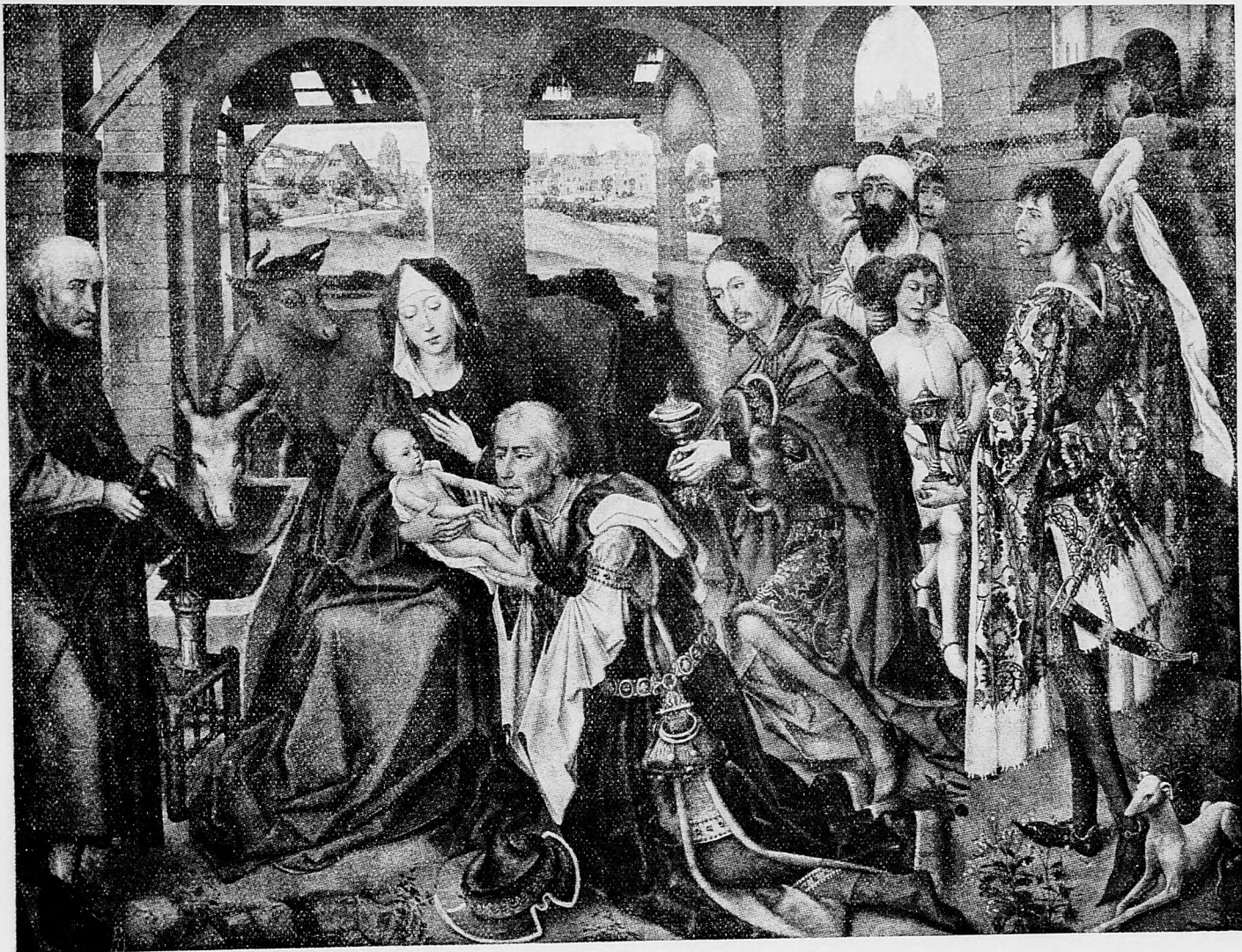
Poklona svätých troch Kráľov.

nič! Teraz ale zas chcú narobiť novej štátnej dlžoby 500 alebo len 100 millionov korún. Na investície nie, lež zaiste na odrotovanie toho liberálneho hrnca. No, aby Khuen-Héderváry vo Viedni ukázal, že Uhorsko neni ešte celkom ožobráčené, veľkodušne dá na vojsko niekoľko millionov, bo dobre vie, že z jeho vojenskej predlohy itak nič nebude.