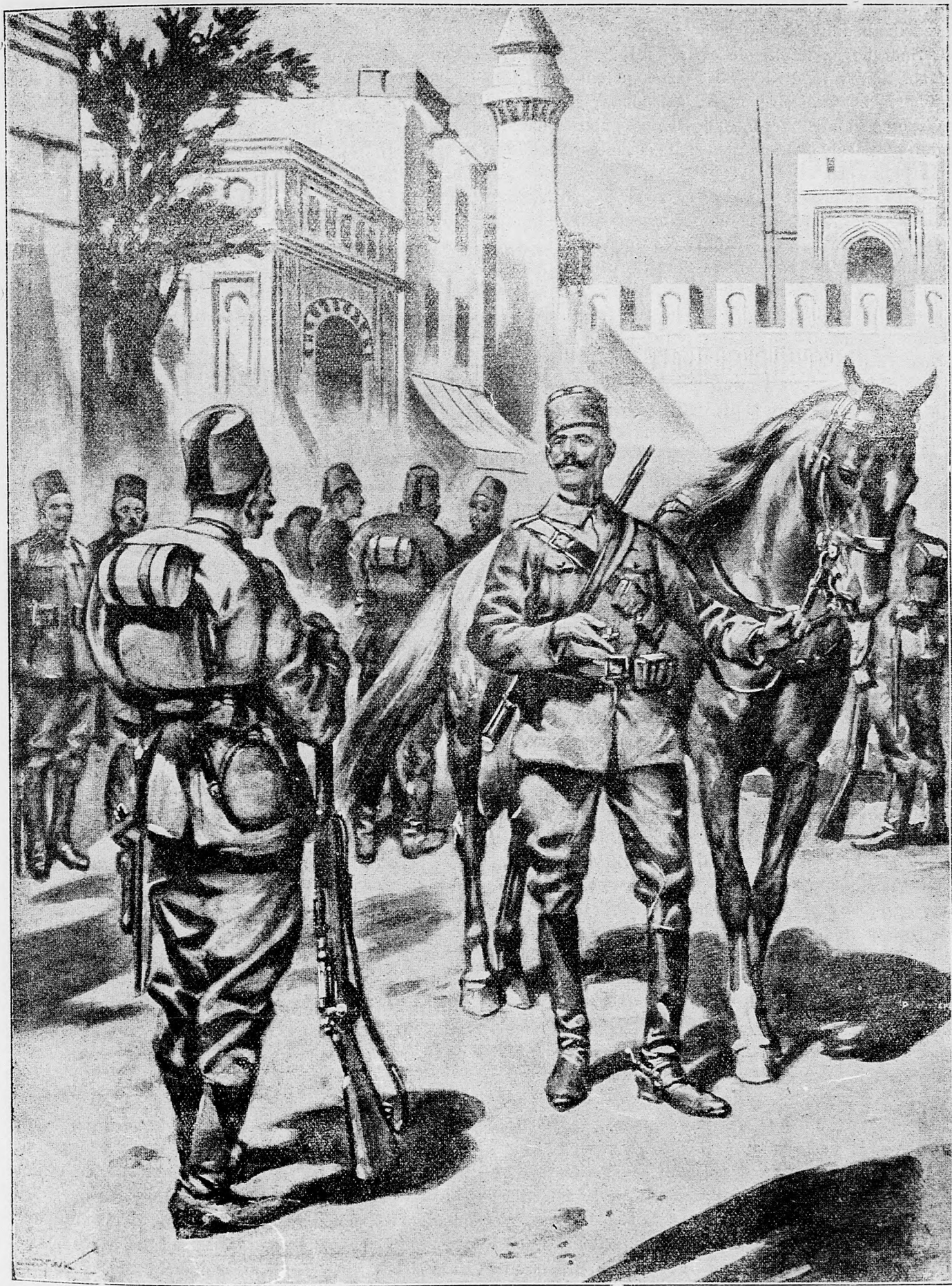
Talinasky jazdec a turecky pešiak.