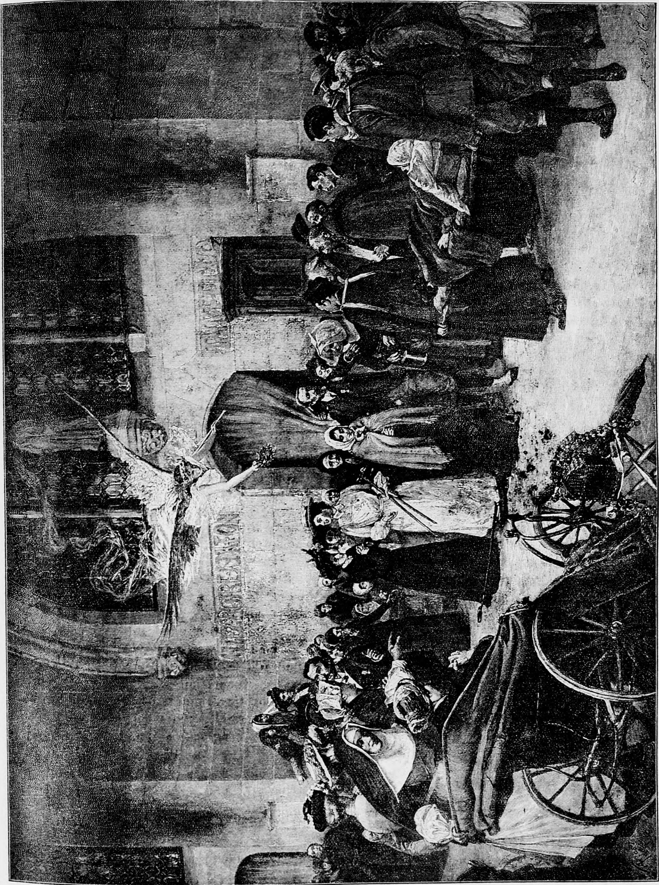
Zázračné vyliečenie na milostnom mieste Maria Lourdes.