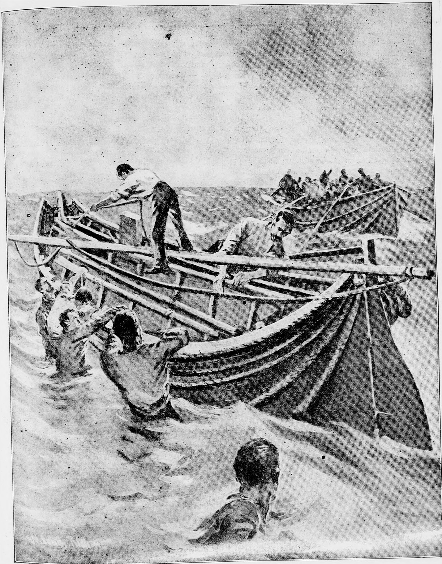
Oc amné nky z plátna a k složeniu.