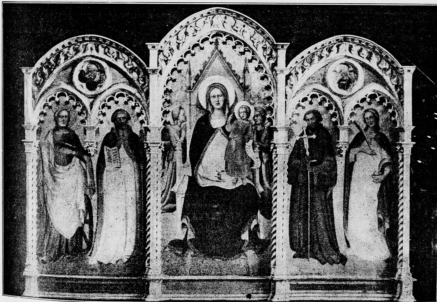
Svätá božia Rodičko, oroduj za nás!

krajinskom sneme ku všeobecnej debatte zapísané bolo ešte 12 rečníkov, keď predseda v hluku väčšinou schválne inscenovanom, predlohy o zbrannej moci za pol minúty vyhlásil prijaté v prvom, druhom i v treťom čítaní. Aj v radoch väčšiny vedelo len málo vyslancov, čo sa stalo. Po zasadnutí ministri skrze vyslancov väčšiny podpísať dali hárok, v ktorom sa osvedčili, že vedeli, na čo hlasovali. Opozícia, ktorá vtedy v zasadnutí zastúpená bola len 30—40 členami,