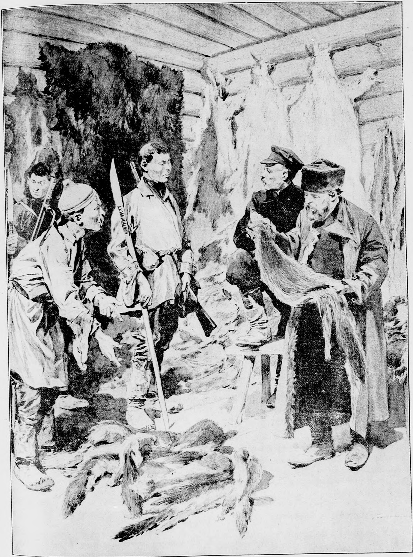
Ruský kozkár v Sibirsku predáva liščie kožky pre vojsko.