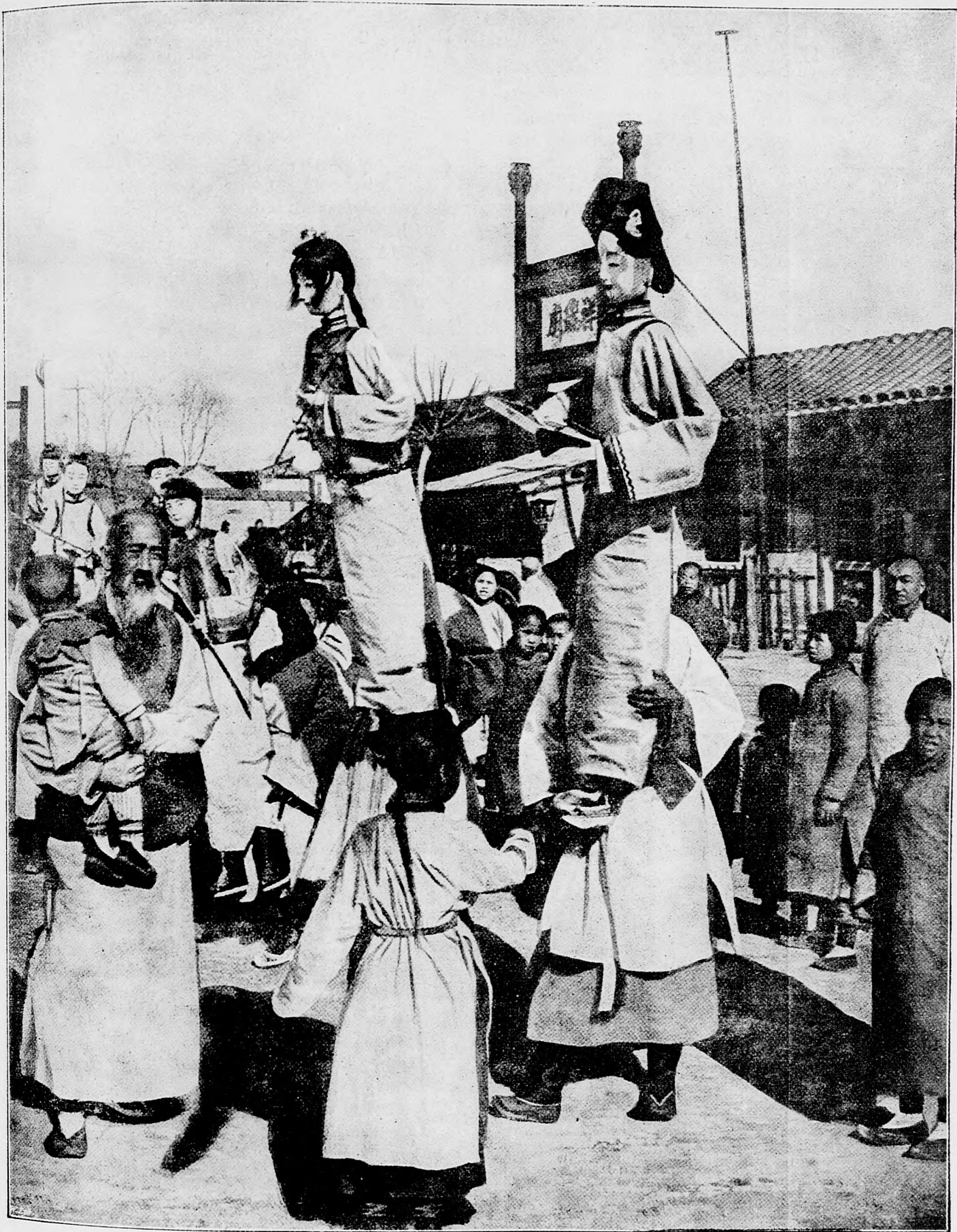
Čínsky pohrüb, slútkami mrtvého predstavujúcimi.