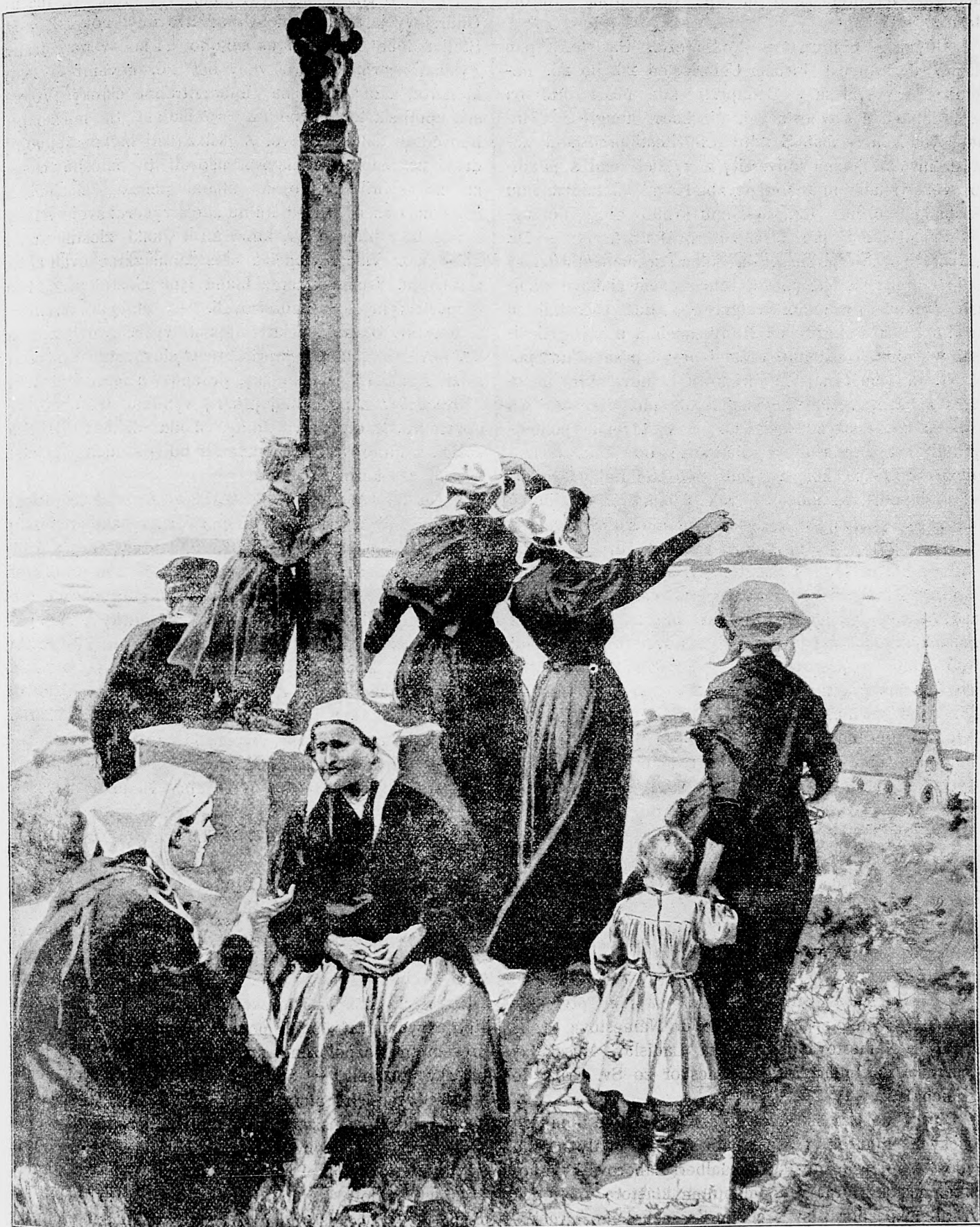
V nádeji a s úzkostlivosťou očakávajú rybárky na brehu mora svojich manželov, či nezahynuli a navráti sa?