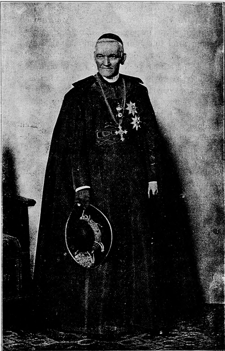
Klaudius Vaszary, knieža-primas na odpočinku.

Tam je Švajciarsko. Vyslanci socialdemokracie po celom Švajciarsku vydržovali shromaždenia, na ktorých agitovali proti vojne. Pomysleť si můžeme, aké to byly reči a policajti predsa nerozohnali ani len jedno shromaždenie. Hja,