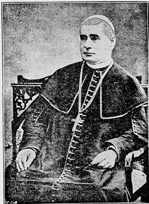
Dr. Jan Csernoch.

Jeho svätosť Pápež Pius X. už 10. novembra vyplnil odôvodnenú žiadosť staručkého a chorľavého kniežaťa primasa a arcibiskupa ostrihomského. Jeho veličenstvo kráľ ako najvyšší apoštolský patrón Uhorska s prípisom od 20. novembra zarovnak a milostive prijal zaďakovanie staručkého kniežaťa primasa a v porozumení so svätým Ocom za kniežaťa primasa Uhorska a arcibiskupa ostrihomského milostive vymenoval kaločského arcibiskupa, skut. vnút. tajného radcu Jána Csernoch.