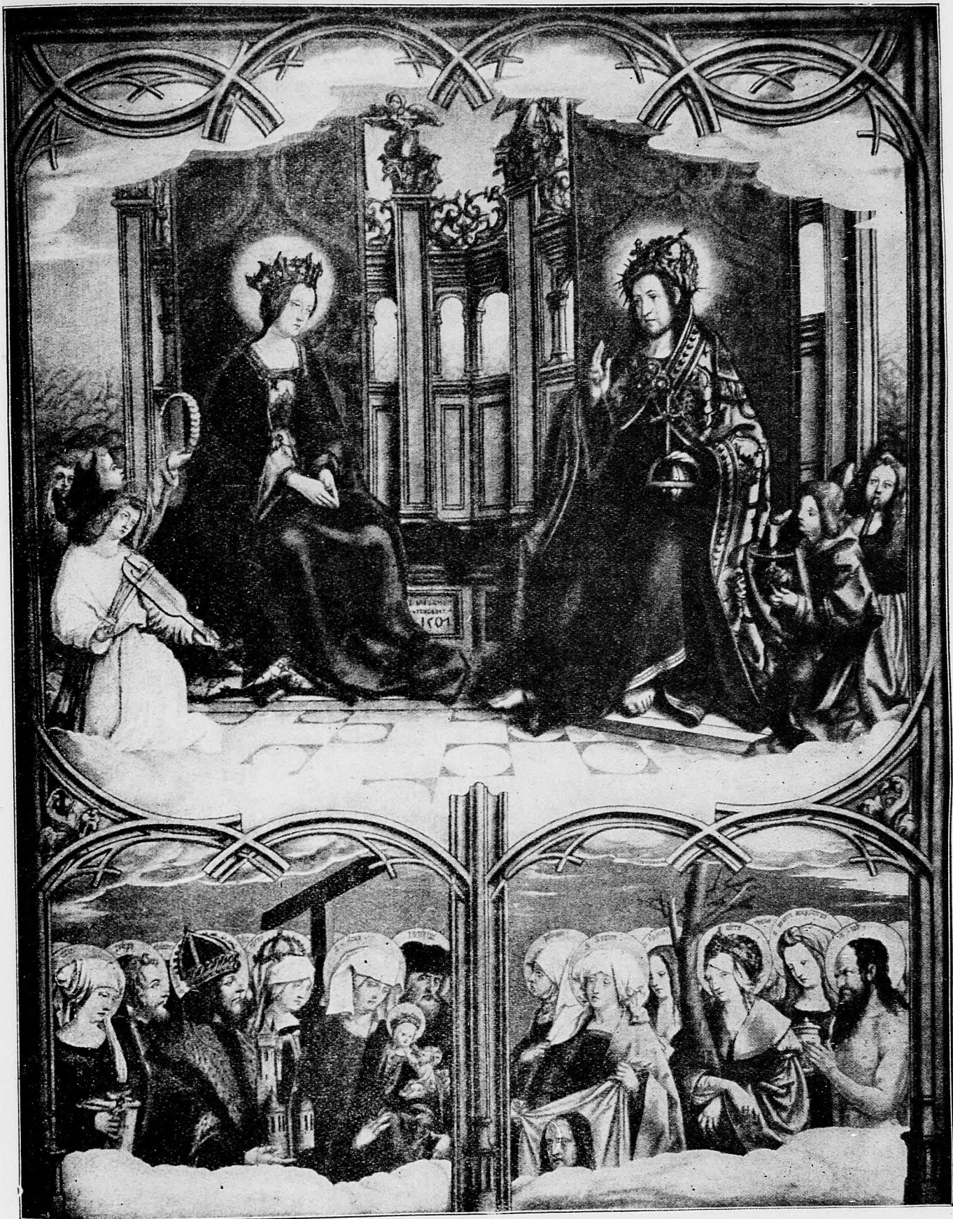
Korunovanie Panny Marie.

nepriateľa zašiancovaná. Rýchly útok našich sa úplne podaril a tamojšie pobranlčné vršky dostaly sa do meci našich. Medzitým však vždy viac sa blížily pomocné čaty nepriateľa, tak že