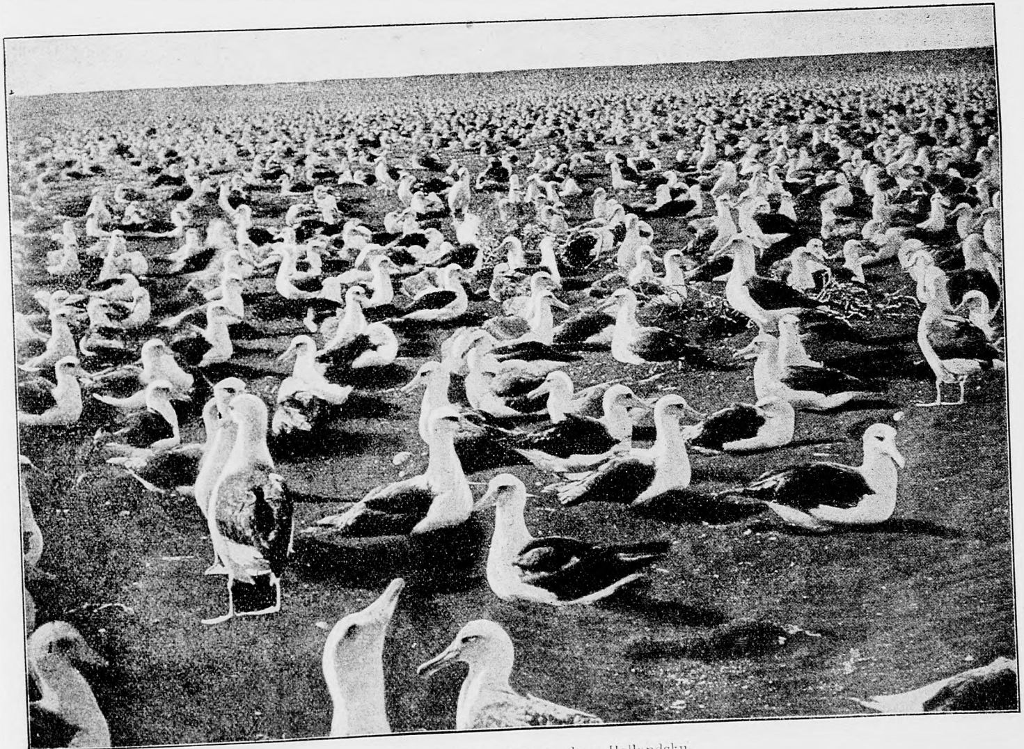
Husy dohovávajúca osada v Holandsku.