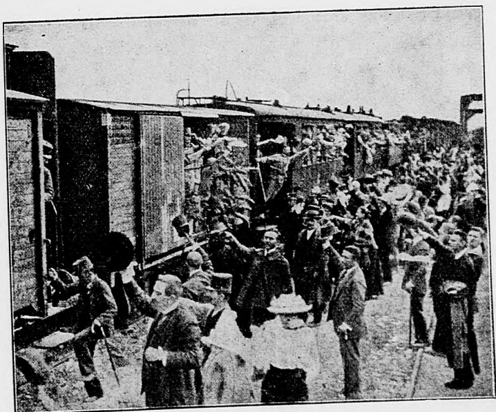
Lúčenie sa s narukujúcimi.

Ako sme už oznámili, naše čaty v jeden utorok na úsvite o pol 3. hodine kryté hustou tmou v nižších údoliach Driny prešli cez rieku a obec L. zaujaly po prudkom boji, zapríčiniac nepriateľovi veľké ztraty. V L. ztrávil sme noc a tam sme prvý raz večerali na srbskej zemi, pri svetle horiacich domov, z ktorých na nás boli strieľali. Na druhý deň naše čaty maširovaly do vnútra Srbska. Počasie bolo pekné a nie veľmi teplé, dva dni sme maširovali bez toho, že by sme boli na silnejší odpor natrafili. Ponevác sa bolo čo obávať, že Srbi pod cesty podložili míny, dve čriedy statku sme dali hnať pred sebou. Táto opatrnosť ale bola zbytočná. Pri L. odbití Srbi cúvli od veľkej obce V. na juhozápad, aby tu, dobre sa zašiancujúc s nami sa znova srazili, s tým úmyslom, že prekazia naše spojenie sa cez K. s druhým vojom, operujúcim ku V. Srbský plán sa zmaril úplne. Naše výtečné delostrelectvo prekazilo dlhšie zdržovanie sa Srbov v ich posíciach. Naši hrdinskí vojaci s výkrikami Éljen! a Sláva! bodákmi vrhli sa na Srbov, ktorí sa dali o zlom krk na útek. Tá obec, o ktorú sa Srbi opierali, zčiasťky stála už v plameňoch, keď sme ta večer vtiahli. Medzitým sme zvedeli, že druhý náš voj pri K. stál v silnom boji so srbskými čatami, ktorým velil udajne knieža Juraj. Aj tam sme