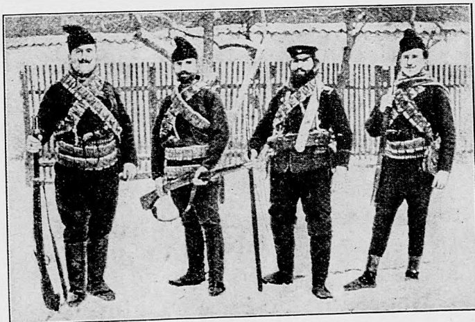
Vodcovia srbských banditov.

Vojenský spolupracovník berlinského «Lokalanzeiger» u na základe správ, ktoré prišly z hlavného štábu, rozvinuje, že nemecké armády nezadržateľne napredujú ku Varšave. Už