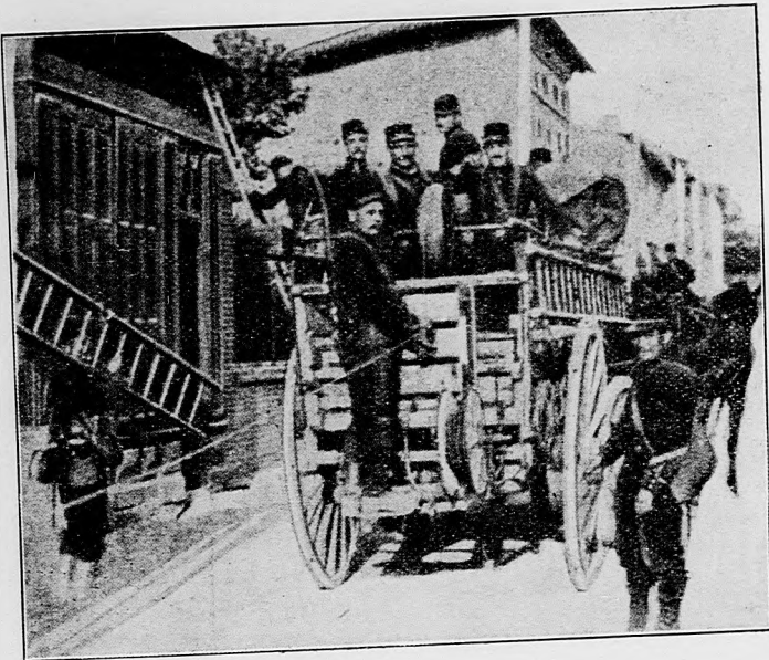
Ťahanie vojenských telegrafičných drôtov.