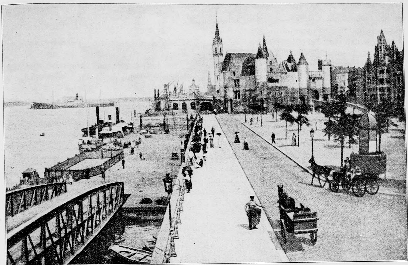
Břeh Scheldy v Antwerpene.