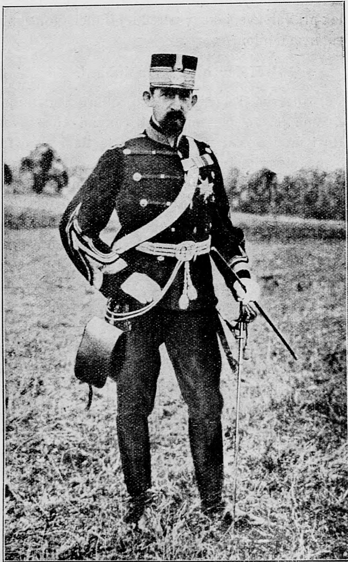
Ferdinand, nový kráľ Rumunska.

Jedon ruský dôstojník v istom švédskom časopise sdeluje, že úlohou asi 50—60 tisíc Rusov, ktorí vtrhli do Uhorska, bolo, aby Srbsko oslobodili z jeho beznádejného položenia. Rusi na piatich miestach vtrhli cez Karpáty. Mali výtečné mappy, tieto dostali od jednej