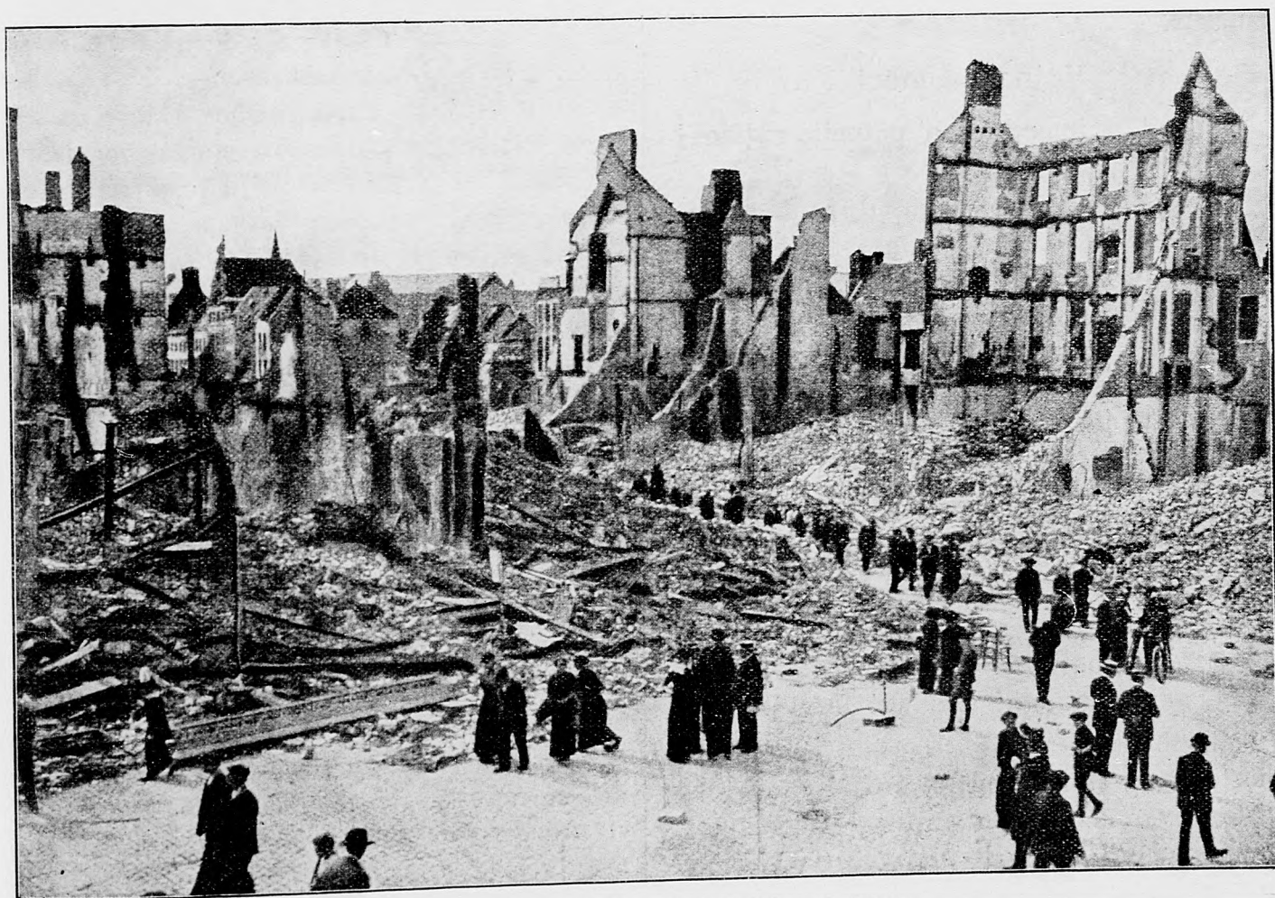
Účínok nemeckých granátov v jednej ulici mesta Löwen.