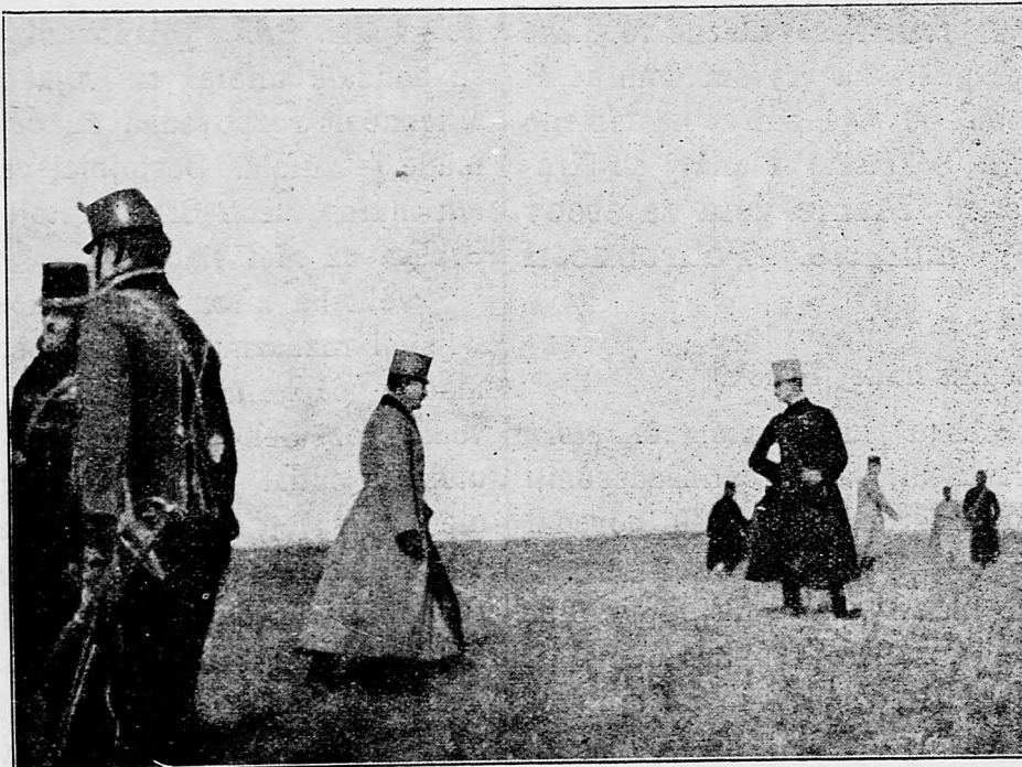
Arciknieža Jozef na bojišti.